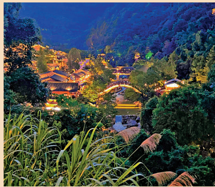
▲望仙谷夜色。