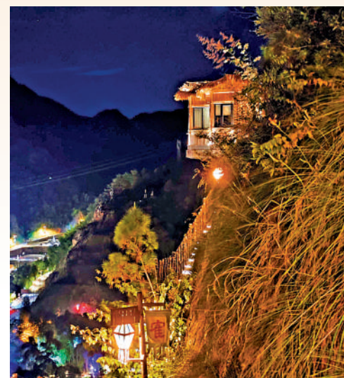
▲望仙谷懸崖民宿，因其獨特的位置吸引大量遊客。

宿。其中，懸崖民宿價格比較貴，每晚價格從數千至破萬，但依然擋不住遊客的熱情。在旅遊黃金季，經常一房難求。