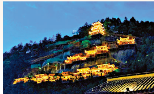
▲望仙谷夜色燈火閃耀。