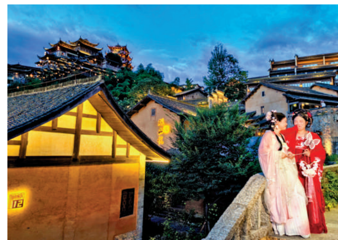
▲女生著漢服，在望仙谷打卡。

城市節奏太快，許多人選擇在這一山片山野裏，享受「偷得浮生半日閒」的慢時光，親睹「春有百花秋有月，夏有涼風冬有雪」的四季變化。春回大地，冰雪融化，萬物復甦；夏日炎炎，蒼翠欲滴，蟬鳴不斷；秋風習習，漫天落葉，碩果纍纍；漫漫冬季，銀裝素裹，蓄勢待發。篝火廣場處，燃起熊熊篝火，氣氛嗨到爆，幾百號遊客一起酣暢拉歌，或者翩翩起舞。若是有DJ或MC現身，互動性更強，歡聲笑語在山谷中迴盪，以至於快樂也能感染到周邊一草一木。行走在垂直高度近百米的玻璃棧道上，底下就是懸崖激流，有凌空而立的刺激