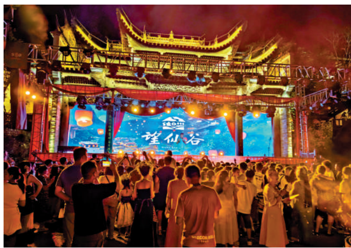
▲望仙谷篝火廣場。

值得一提的是，新建的房子遮住了以前開採山體所造成的痕跡，呈現在眼前的是懸崖上的小鎮。鱗次櫛比的黃牆灰瓦夯土房，街道上錯落有致的青石板，臨街鋪面帶着歲月痕跡的木門，最搶眼的是高聳馬頭牆，留住了傳統村落的神韻。望仙谷具有濃郁的贛家鄉村文化，包括江西特有的建築、環境、農業種植、飲食、古法的手藝、手作。比如，引進紅糖、榨油、釀酒、年糕、豆腐、葛粉作坊，上百種特色小吃，可讓遊客回味當地人童年時的味道。同時，緊盯新時代年輕人消費理念，將遊戲經典地圖「十方鎮」