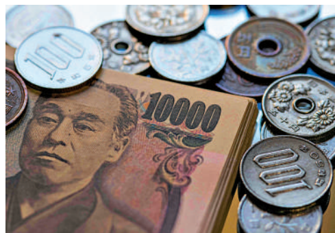
▲日圓急升，每百日圓兌港元回升至5.48。

投資者憂慮美聯儲維持長期高利率令全球陷入經濟衰退餘震未了，亞洲股市受承接美股上周五重創影響，周一甫開市即暴跌，投資者蜂擁撤出風險資產；同時，日圓曾急升3.3%，報141.7水平，每百日圓兌港元升至5.48，引發套息交易政策拆倉潮，此舉令股市跌勢雪上加霜，日股大瀉4451點幅度超過12%，盤中更觸發熔断機制停市。