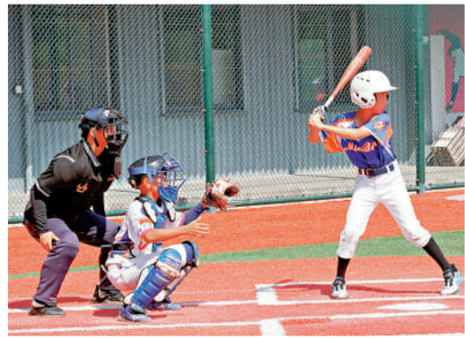
▶兩岸青少年棒球隊6日進行比賽。

【大公報訊】記者蔣煌基龍岩報導：以「青春之棒，築夢未來」為主題的2024年東森杯海峽兩岸（連城）青少年棒球邀請賽暨第五屆海峽兩岸（連城）青少年棒球文化節，6日在福建省龍岩市連城縣開幕。