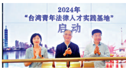
▲上海「台灣青年法律人才實踐基地」為台青提供實習機會。

【大公報訊】記者張帆上海報導：2024年第七屆上海市靜安區「台灣青年法律人才實踐基地」項目最近開幕。這一項目旨在更好地