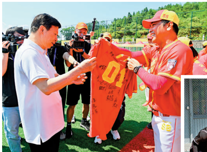
▲閩台聯合福建棒球隊6日向中共中央台辦、國務院台辦主任宋濤贈送簽名球衣。

【大公報訊】記者蔣煌基龍岩報導：以「青春之棒，築夢未來」為主題的2024年東森杯海峽兩岸（連城）青少年棒球邀請賽暨第五屆海峽兩岸（連城）青少年棒球文化節，6日在福建省龍岩市連城縣開幕。