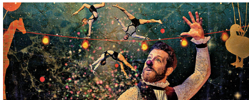
▲「西九家Fun藝術節」呈現多場老幼皆宜的表演節目。