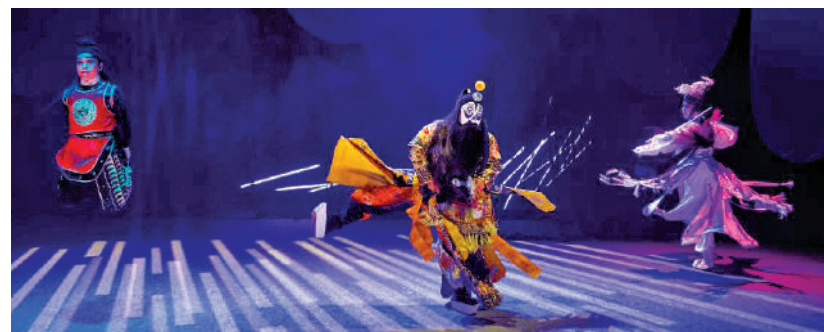
▲重慶市川劇院帶來小劇場川劇《霸王別姬》。