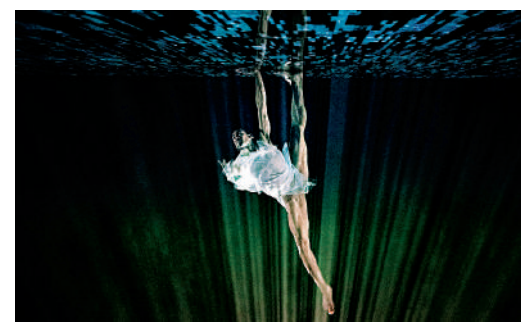
▲《深淵水母》亞洲首演將在戲曲中心大劇院舉行。

Papaioannou製作長達6小時的錄像裝置《內情》，觀眾可欣賞生活日常風景，更附上其拍攝幕後紀錄片《幕後內情》等。