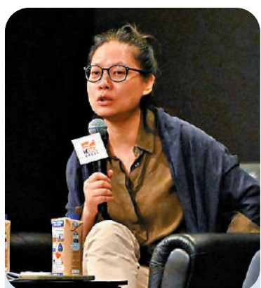
▲內地影評人毛尖分享自己對金庸武俠小說感悟。