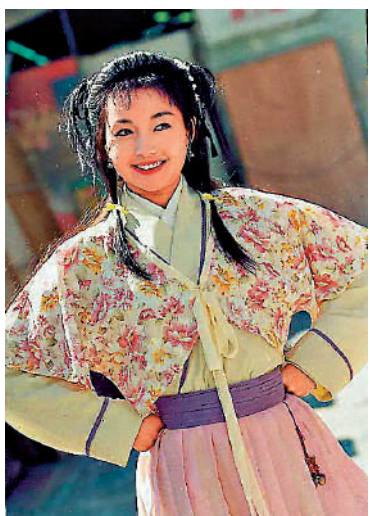
▲《神鵰俠侶》中的郭襄，成全楊過和小龍女的愛情。