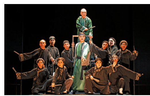
▲原創音樂劇《大狀王》明年6月在上海演出。

第二屆「自由舞」將於11月21日至12月15日舉行，以「Re: TIME and SPACE」為題，通過不同藝術家的作品重新探索、回應和想像時間和空間的概念，如希臘編舞者Dimitris