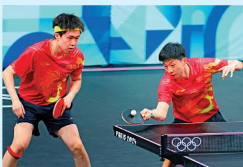
▲中國組合馬龍（右）／王楚欽在比賽中。