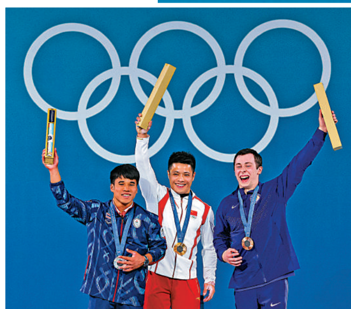
▶李發彬在抓舉以143公斤的成績，打破奧運紀錄。