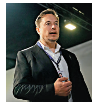
▲馬斯克就旗下社交平台被撤廣告一事，起訴廣告商聯盟。

馬斯克6日在X上發帖，敦促其他面臨廣告商抵制的公司也提起訴訟，他說，「我們嘗試了兩年的和平，現在卻變成戰爭。」