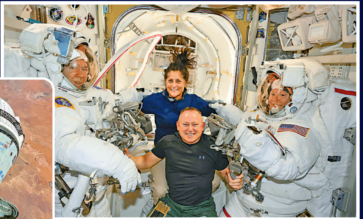
▲6月24日，美國太空人威廉姆斯(中後)和威爾莫爾(中前)在國際太空站與執行其他任務的美國太空人合影。