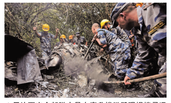
▲尼泊爾安全部隊人員在直升機墜毀現場搜尋遇難者。

上述墜機意外發生前兩周，加德滿都7月24日也出現小型飛機墜機事故，除機師外，機上18人全部罹難。當時機上有17名技工，他們準備前往博卡拉維修另一架飛機，意外原因仍在調查中。