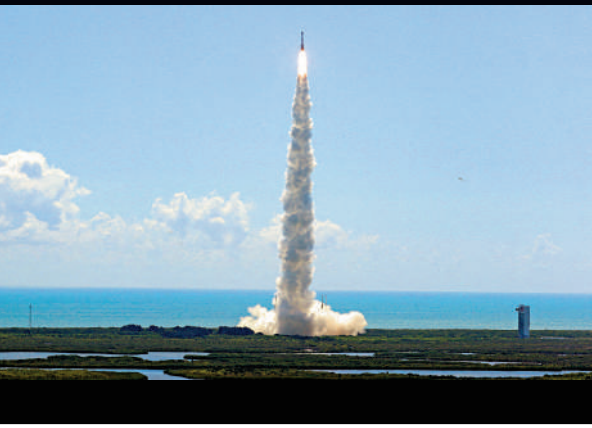
▲「星際客機」火箭於6月5日發射。

推進器失效 ● 2022年5月19日第二次無人試飛測試時，太空船兩個推進器失效，但仍成功與空間站對接，並返回地球。