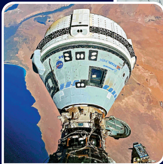
▼「星際客機」與國際空間站對接。

波音一直期望研製太空船與SpaceX競爭。隨著「星際客機」問題持續，本次返航推遲已給波音造成1.25億美元(約9.75億港幣)損失。波音與NASA簽訂的45億美元(約351億港幣)研發合約，目前也超支了逾10億美元(約78億港幣)。此外，從2016年起，該公司在「星際客機」項目上的累計虧損已達到16億美元(約120億港幣)。(美聯社/CNN/CNBC)