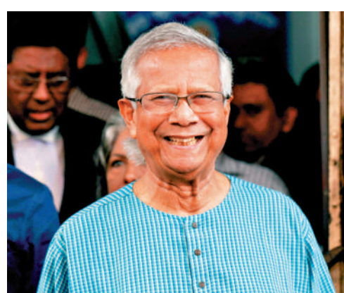
▲諾貝爾和平獎得主尤努斯將領導孟加拉國臨時政府。

孟加拉國近期多次發生不滿工作相關制度的抗議活動，抗議中的暴力事件共導致200多人死亡。5日，該國總理哈西娜辭職。6日，楚普宣布解散國民議會。中國外交部就哈西娜辭職回應說，中方正密切關注孟加拉國局勢。作為友好近鄰和全面戰略合作夥伴，中方真誠希望孟加拉國早日恢復社會穩定。