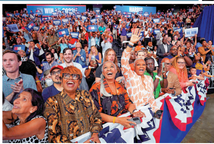
▲民主黨支持者6日在費城參加哈里斯和沃爾茲的競選活動。

已鎖定美國民主黨總統候選人提名的哈里斯6日宣布，選擇明尼蘇達州州長沃爾茲為競選搭檔。當晚，哈里斯和沃爾茲在賓夕法尼亞州舉行的競選活動上首次聯合亮相，開啟在關鍵搖擺州持續5天的造勢活動。美媒稱，首場活動的重點在於向選民介紹「大部分美國人都不熟悉」的沃爾茲。有分析指出，哈里斯選擇沃爾茲，是民主黨黨內交易的結果。沃爾茲雖知名度不高，但得到奧巴馬等民主黨大佬支持。