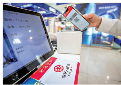
▲ 內地旅客來港消費，將可以使用數字人民幣。

此外，中銀今年5月推出BoC Pay「數字人民幣專區」以來，該行客戶綁定中國銀行數字人民幣錢包的數目持續上升。