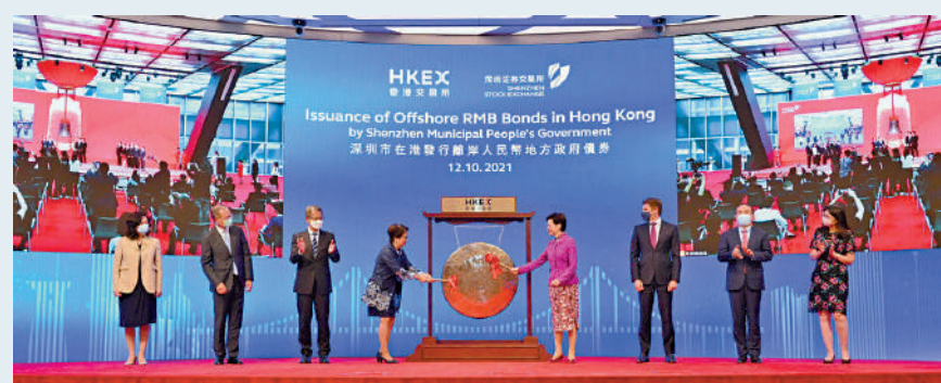
▲ 深圳市政府2021年在港成功發行離岸人民幣債券。