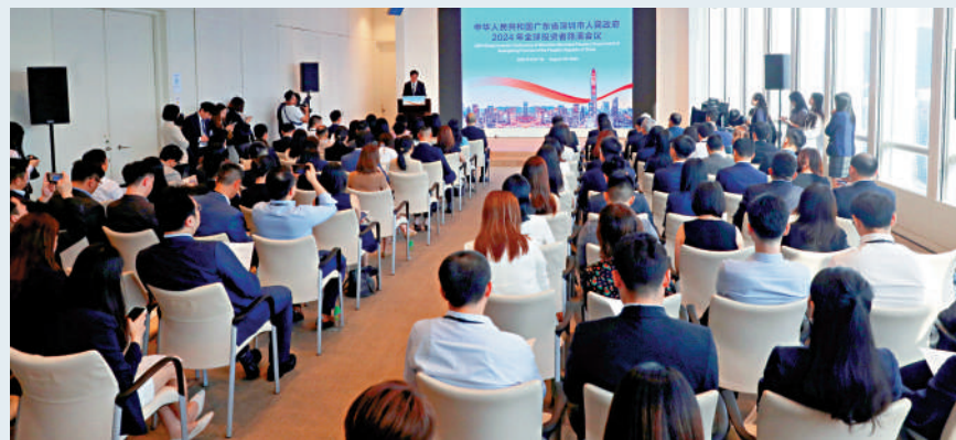
▲ 深圳市政府在港舉辦2024年離岸人民幣地方政府債券路演。