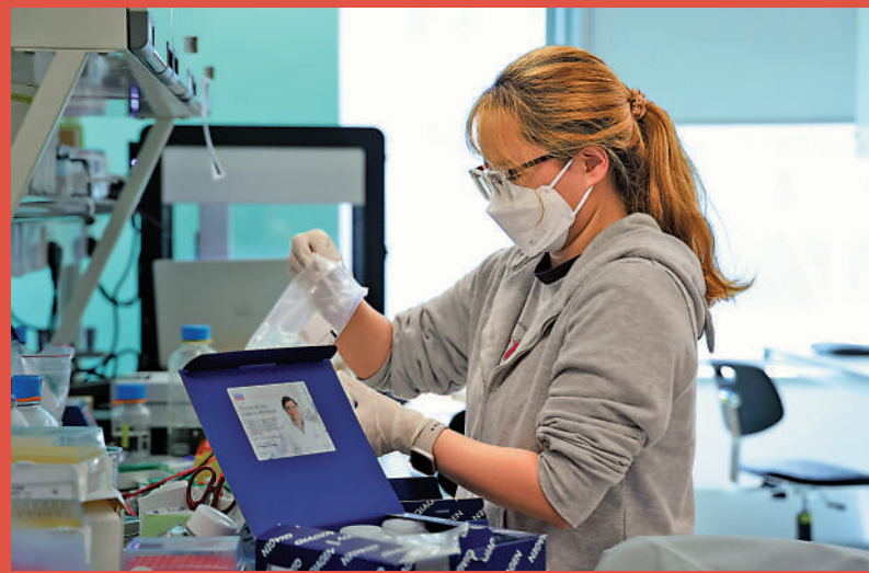
位於北都的新田科技城將成為創科發展集群的樞紐，助力香港實現「南金融、北創科」的新產業布局。