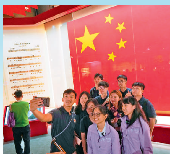
「香港特別行政區國家安全展覽廳」昨日起向公眾免費開放。圖為部分導賞員於五星旗屏幕前留影。