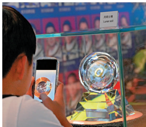
市民在展覽場內可觀看到罕有的月壤。