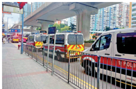
▲大批警員事發後到達派對房所屬大廈附近一帶調查。