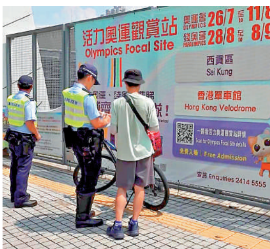
▲警方昨日展開名為「亮景」及「朝陽」的全港性大型專題執法行動。

根據警方最新數據,今年上半年有392人涉及致命及嚴重受傷意外,其中51人在交通意外中喪生;上半年亦錄得7宗致命單車意外,已超過去年全年的6宗,行人仍是高風險群體,但數字已減少近五成,涉及司機、乘客及單車人士的數字則上升一倍。