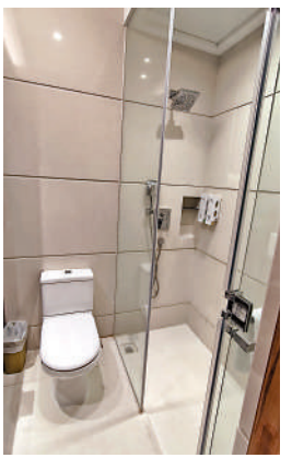
▲琇居基本設施齊全。