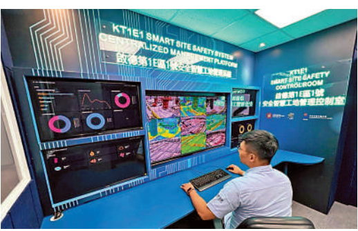
▲房協在啟德一個「安全智慧工地」設中央控制中心。

房協並會在所有新項目實行「安全支付計劃」，即在合約預留既定成本金額，佔合約總額約0.3%至0.6%，由房協承擔安全措施的開支，以確保承建商有足夠資金妥善落實及加強工地安全。張冠華說，若25萬元或以上的項目，房協將支付800萬至900萬元，若為25萬元以下的項目，房協則支付400萬至500萬元左右。