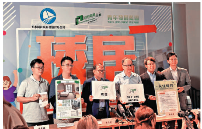
▲琇居舉行招租發布會。