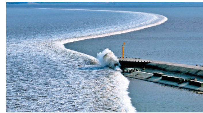
錢江潮奔湧向前，蔚為壯觀。