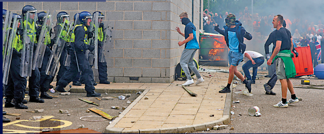
◀反移民示威者4日在羅瑟勒姆與警方發生衝突。