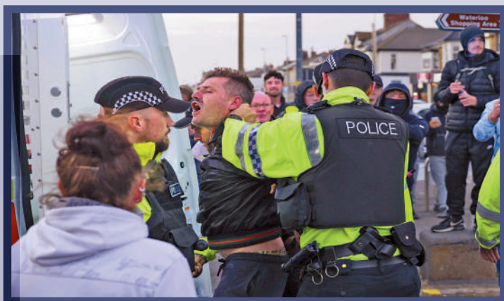
◀警方7日在布萊克浦逮捕一名示威者。