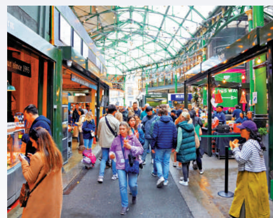
▲英國經濟不景氣，部分政客將之歸咎於移民問題。資料圖片

下的經濟不景氣等社會問題歸咎於移民。《聯合早報》指出，英國大規模接納宗教文化迥異的移民，卻缺乏有效的促進融合機制，導致社會矛盾不斷加深；因財政困窘無力維持有效的地方治安，民間矛盾得不到及時處理，為極端主義提供了溫床。