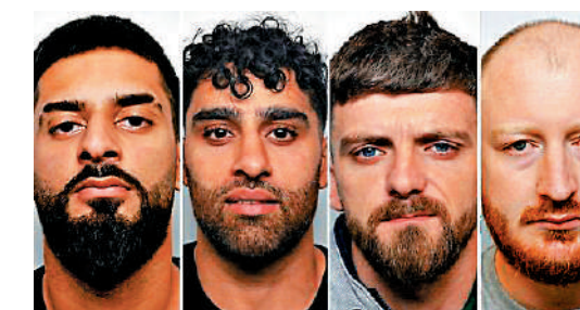
▲利茲法院9日宣布對4名騷亂參與者的判決。