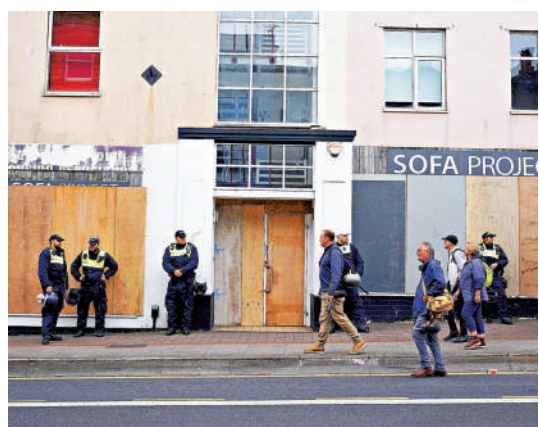
▲布里斯托的商店7日紛紛關門，防止遭示威者破壞。

英國連鎖超市Tesco、平價超市Pound land等近日紛紛宣布提前關門，以防遭示威者劫掠。7日，位於布里斯托的Pound land超市貼出告示稱：「由於示威活動計劃於今晚進行，出於員工安全考慮，本店於17時提前停業。」