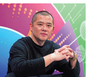
▲任哲指香港是中國文化出海和傳播的好平台。

【大公報訊】記者陸九如報導：青年發展高峰論壇演講嘉賓、雕塑藝術家任哲認為，香港是一個非常適合發展藝術產業的地方。他表示，香港是一個多元的國際化城市，作為文化傳播的橋樑，每天都有世界各地的藝術信息在這裏交匯融合。任哲發展藝術工作最重要的兩個條件，是對事物本質思考的深度和視野的廣度，而香港是一個深度與廣度兼備的城市。 任哲表示，相當欣賞香港社會對藝術和美的追求，認為香港市民懂得欣賞、尊重藝術成果，指這樣的環境