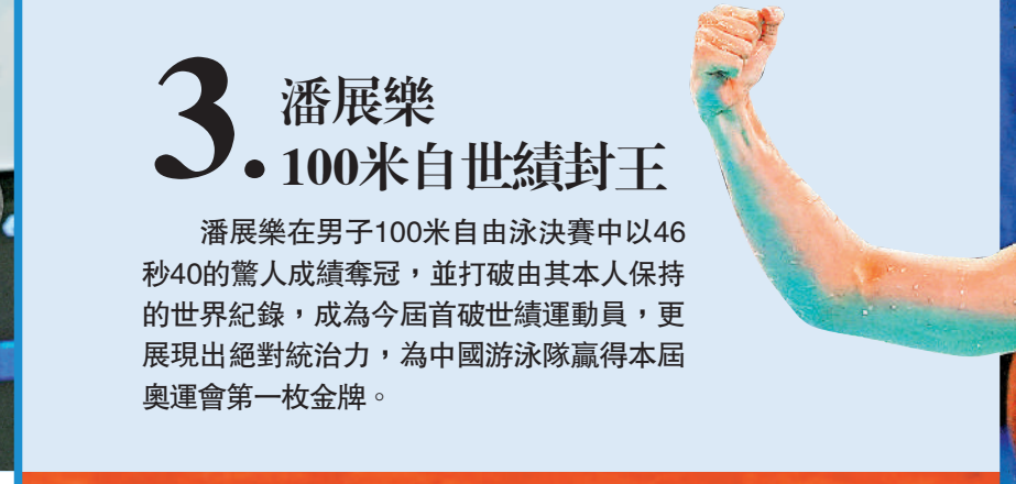
◀潘展樂破世績100米自由泳奪金後，振臂歡呼。

3. 潘展樂 100米自世績封王 潘展樂在男子100米自由泳決賽中以46秒40的驚人成績奪冠，並打破由其本人保持的世界紀錄，成為今屆首破世績運動員，更展現出絕對統治力，為中國游泳隊贏得本屆奧運會第一枚金牌。