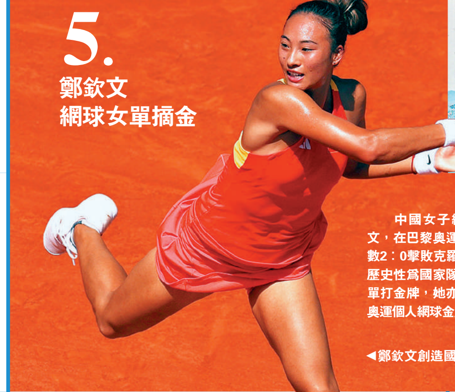
◀鄭欽文創造國家隊奧運網球女單歷史。

5. 鄭欽文 網球女單摘金 中國女子網球「一姐」鄭欽文，在巴黎奧運女單決賽中，以盤數2:0擊敗克羅地亞名將赫妮絲，歷史性為國家隊首奪奧運女子網球單打金牌，她亦是亞洲歷史上首枚奧運網球金牌得主。