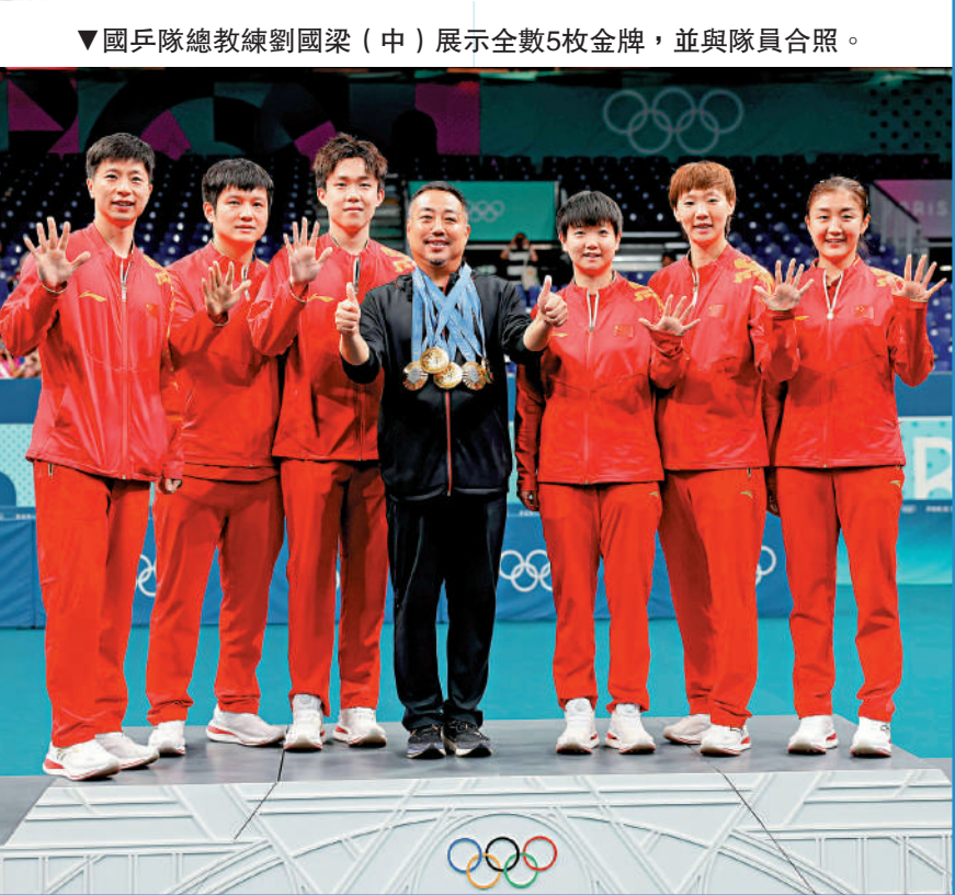
▲國乒隊總教練劉國梁(中)展示全數5枚金牌，並與隊員合照。

欣瑜/張之臻取得銀牌，同樣寫下歷史新篇章。今屆國家隊在一些非傳統強項方面，展現出超乎實力而站上了頒獎台最高一級。花樣游泳隊在團體項目上憑藉近乎完美的發揮，經歷連續3屆取得銀牌後，終於在歷史性摘下金牌。 藝術體操隊在團體賽除了為國家隊首奪金牌外，更成為該項目1996年設立以來，史上首支來自歐洲以外的代表隊贏得金牌。拳擊方面，常園為國家隊打開了奧運女子拳擊的金牌之門，之後還有多兩枚金牌入賬。 此外，開幕式持旗手之一、乒乓球手馬龍累積6枚金牌，榮膺國家隊奧運「金牌王」。跳水全紅嬋技驚四座的「水花消失術」、羽毛球冰嬌領獎時向西班牙對手馬蓮致意等，都賺得觀眾由衷掌聲。總括而言，國家隊不論在競賽成績、金牌總數、新秀接棒、運動風尚等各方面，都取得美滿豐收。