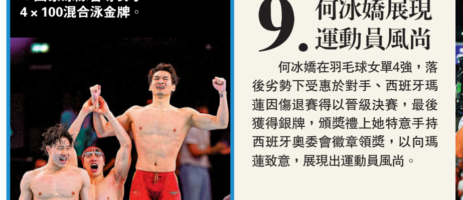
▼國家隊首奪男子4×100混合泳金牌。

7. 三隊際項目 歷史性稱冠 國家隊在今屆的男子4×100米混合泳接力、花樣游泳及藝術體操3個隊際項目，歷史性首稱冠。其中混合泳隊一舉打破美國超過40年來的壟斷，藝術體操亦是史上首支非歐洲的金牌隊伍。