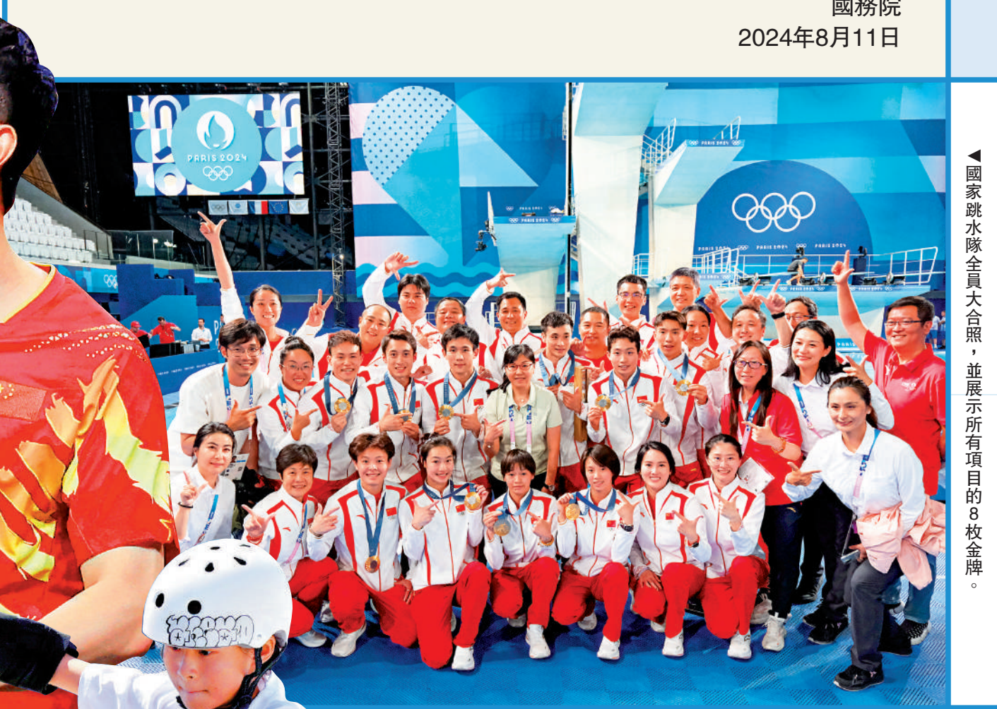
▲國家跳水隊全員大合照，並展示所有項目的8枚金牌。

4. 馬龍累積6金 膺「金牌王」 乒乓球名將馬龍，與王楚欽及樊振東組隊出戰男團，他們在決賽擊敗瑞典，助國家男乒自乒乓球男團於2008年成為奧運項目以來，實現團體賽5連冠，馬龍出戰4屆奧運獲6金成代表團金牌王。