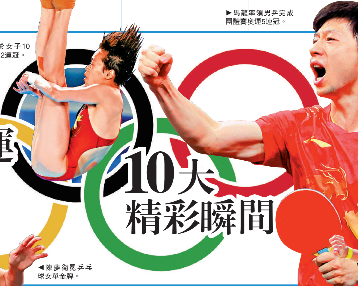
▶馬龍率領男乒完成團體賽奧運5連冠。

6. 名將狀態巔峰 成功衛冕 多位名將在個人項目上成功衛冕金牌，包括跳水的金紅嬋、乒乓球的全紅嬋、體操的劉洋和鄭敬園、跳水的謝思埜和曹緣、舉重的李發彬、侯志慧和李雯雯，足證3年來各人保持狀態。