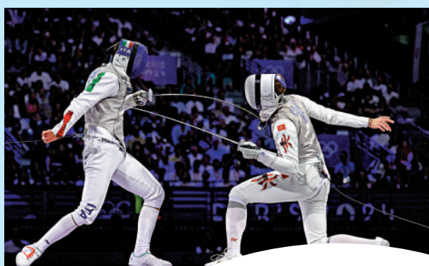
◀張家朗(右)擊敗意大利劍手，成功衛冕。