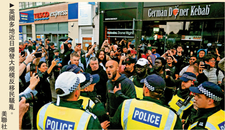
▲英國多地近日爆發大規模反移民騷亂。

馬斯克並未因此噤聲，依舊在X平台大量發布和轉發批評英國的帖子。倫敦大都會警察局局長羅利警告那些在網上「煽動仇恨的外國人」將會受到指控，其中就點名了馬斯克。