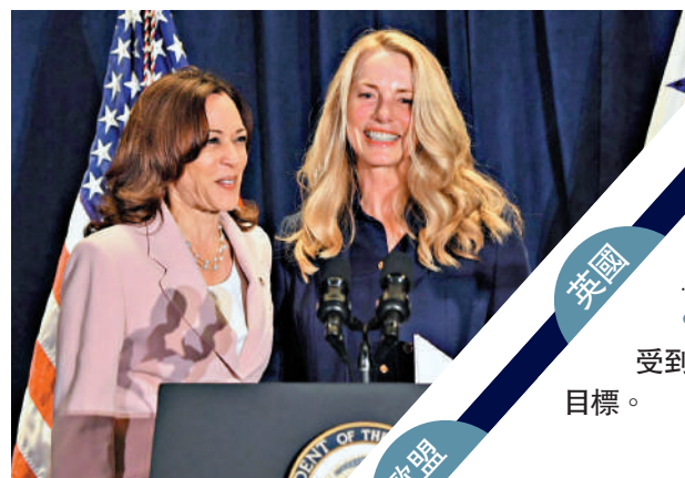
▲喬布斯遺孀、慈善家鮑威爾（右）是哈里斯的長期支持者。