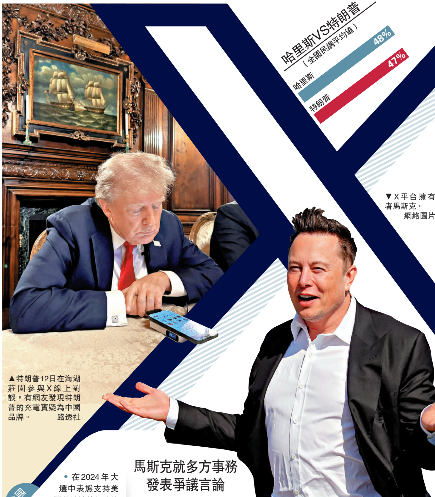
▲特朗普12日在海湖莊園參與X線上對談，有網友發現特朗普的充電寶疑為中國品牌。

另外，哈里斯在加州長大並開始從政，與硅谷淵源深厚。蘋果公司創辦人喬布斯的遺孀、慈善家鮑威爾、Salesforce執行總裁貝尼奧夫和前Fb首席運營官桑德伯格都是她的長期支持者。（綜合報道）