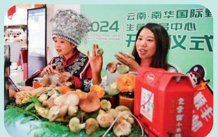
▲8月8日，在雲南省南華國際野生菌交易中心內，商家進行網絡直播售賣野生菌。

● 1-7月，實物商品網上零售額同比增長8.7%，快於社會消費品零售總額5.2個百分點；佔社會消費品零售總額比重25.6%，較上半年提升0.3個百分點