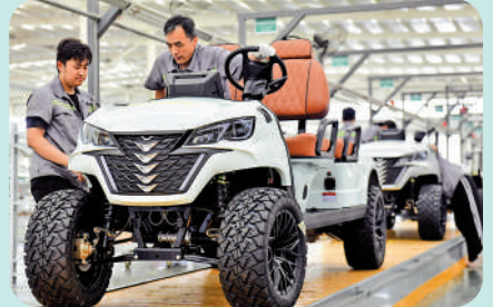
▲7月24日，在山東一家新能源車企業內，工作人員在流水線上生產高爾夫球車。