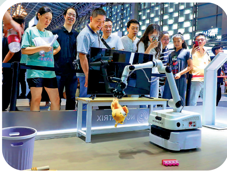
▲7月6日，一款具備物體識別功能的智能家居機器人在上海2024世界人工智能大會上進行作業演示。