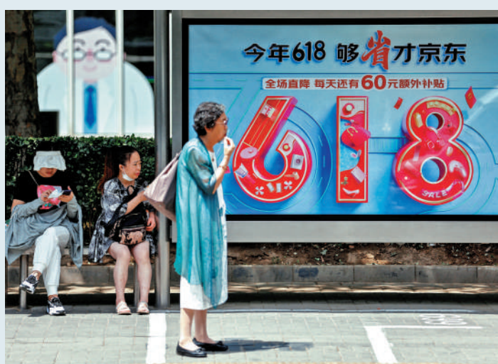
▲在「618」購物節大促的效應下，京東上季業績遠超市場預期。