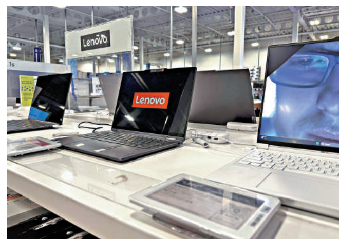
▲聯想表示，AI PC正推動個人電腦市場進入新一輪的換機周期。

聯想第二季營業額升20%至154.47億美元(約1205億港元)。雖然個人電腦業務仍為聯想的核心業務，但上季來自非個人電腦收入貢獻升5個百分點至47%，創歷史新高。楊元慶表示，非個人電腦業務3年內佔比達50%的目標不變。