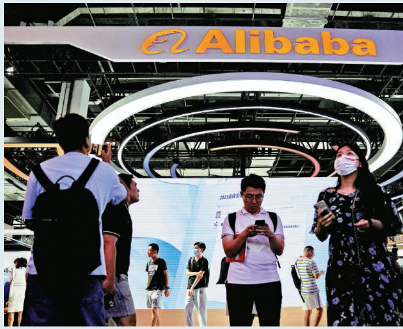
期。阿里首財季經調整淨利潤為406.91億元，略勝市場預