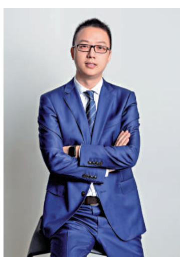
物體驗，從而提升購買頻次及增加收入。

阿里國際數字商業集團(AIDC)上季收入錄得292.93億元，按年增長32%。AIDC首席執行官蔣凡表示，希