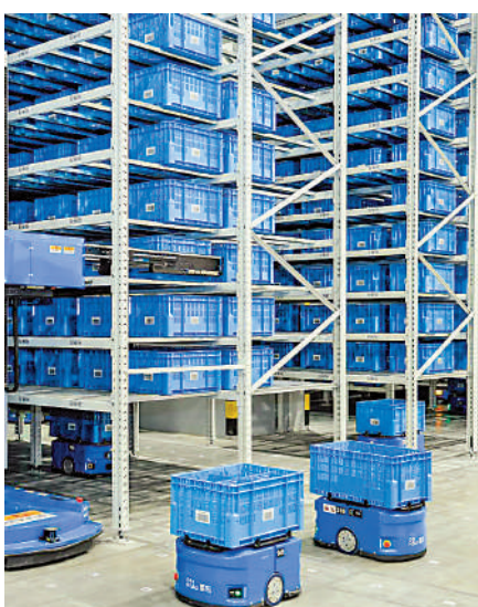
▲iHerb已入駐香港國際機場的菜鳥香港履約中心，菜鳥專門為iHerb提供上下存揀的自動化揀選解決方案。