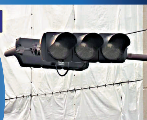
▲大阪市和守口市至少140個紅綠燈熄滅。視頻截圖

查、居家防災、應急避難等，遠離海邊、河道及山區，確保人身安全。如遇緊急情況，及時向日本警方報案，並聯繫駐日使領館求助。