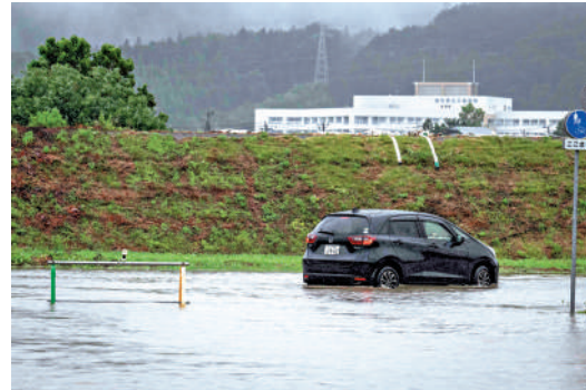
▲日本進入颱風多發季。圖為岩手縣12日遭遇颱風襲擊後，洪水湧上道路。