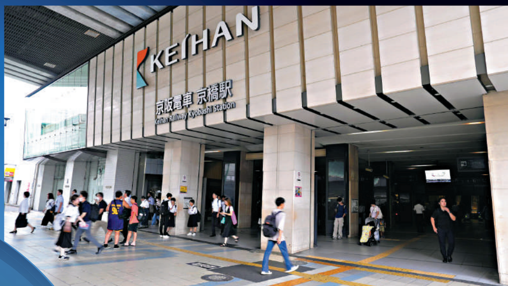
▲民眾在京阪電鐵京橋站等待。網絡圖片