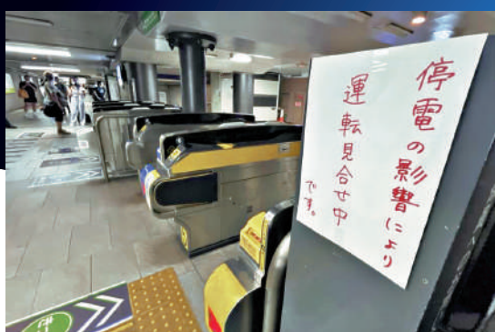
大阪15日發生大規模停電，多趟列車停駛。網絡圖片

日本大阪地區15日凌晨突然大停電，大阪市和守口市有多達24.5萬戶家庭停電。受停電影響，京阪電鐵、JR西日本多個區間延誤或取消，停電原因仍在調查中。另外，颱風「安比」16日恐直撲日本關東等地區，部分新幹線列車將停駛，約600班國內及國際航班取消。有網友在社媒平台X驚呼：「又是地震，又是颱風，大阪還停電，（日本）這個月到底怎麼了？」