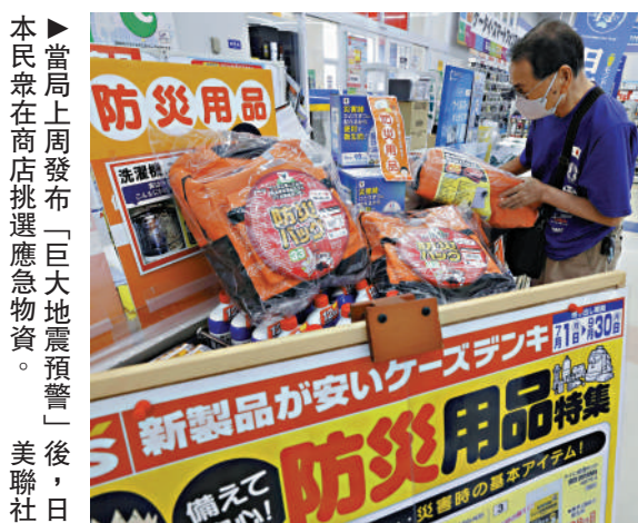
▲當局上周發布「巨大地震預警」後，日本民眾在商店挑選應急物資。