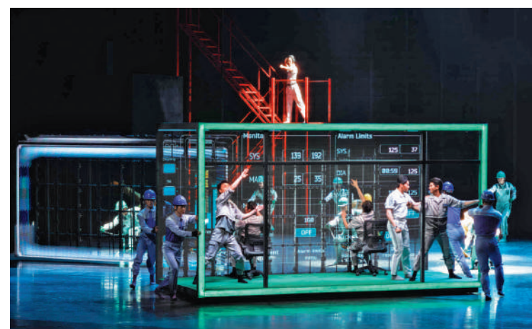
▲舞劇創新運用集裝箱元素。▲舞劇《東方大港》海報。

團隊將視野聚焦於大港中小人物的生活，以「真實」的觀感和動態，再現了港口發展洪流中的眾生相。這些「小人物」，無不是當代大千世界中「你我」的縮影，將這些平凡人物通過舞蹈化的處理，以舞劇的形式進行塑型，成功消解了觀者心理的觀劇距離，做到了真實的情感共鳴。該劇切實地提升了我國現實題材舞劇創作的自信心，讓舞蹈與現實生活、平凡人物有了真切的關聯，用新的敘事視角，詮釋了我國當代舞劇創作如何體現「以人民為中心」的創作理念。