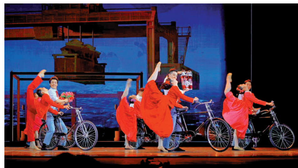
▲《東方大港》再現港口發展洪流中的眾生相。