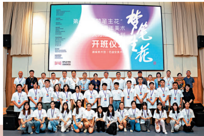
▲「夢筆生花」閩港澳台青年美術人才成長計劃8月10日開班。