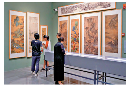
▲「盛世修典——中國歷代繪畫大系」成果展·浦城特展一隅。

「中國歷代繪畫大系」是習近平主席親自批准，多年來一直高度重視、持續關注的一項規模浩大、縱貫歷史、橫跨中外的國家級重大文化工程。該項目共收錄海內外263家文博機構的紙、絹（含帛、綾）、麻等材質的中國繪畫藏品12405件（套），是迄今為止同類出版物中精品佳作收錄最全、出版規模最大的中國繪畫圖像文獻。