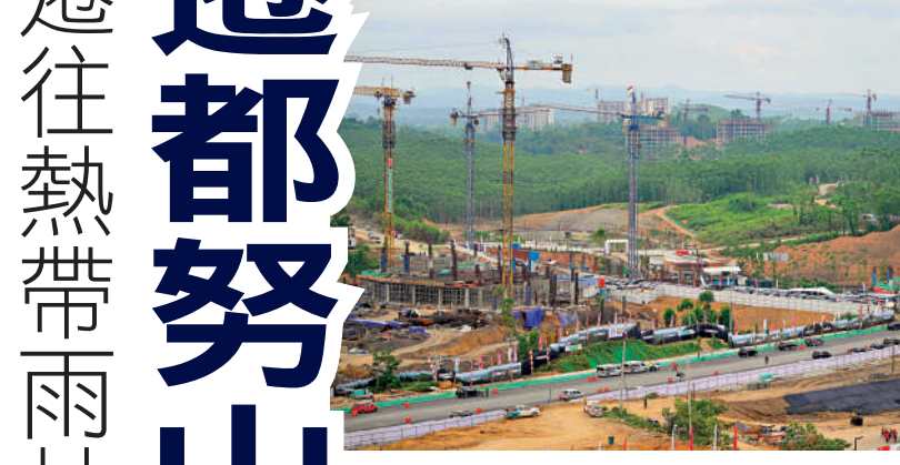
▲努山塔拉的政府辦公室仍在建設中。法新社