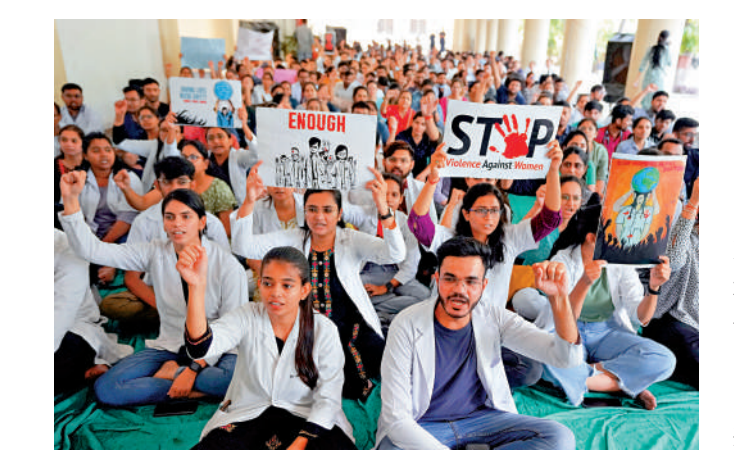
▲印度醫生17日舉行大罷工，抗議加爾各答的實習女醫生慘遭姦殺。

罷工醫生要求當局實施旨在保護醫護人員免受暴力傷害《中央保護法》。印度醫學協會表示，上述姦殺案是「由於缺乏女性安全空間而發生的野蠻規模的罪行」，並要求當局加強醫院安保，創造安全的休息空間，保護醫護人員免受暴力對待。印度總理莫迪15日要求迅速懲罰那些對婦女犯下「滔天罪行」的人。在印度，針對婦女的性暴力是一個普遍存在的問題，平均每天發生近90起強姦案。