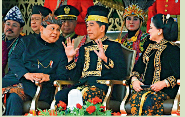
▲8月17日，印尼總統佐科（中）與候任總統普拉博沃（左）出席國慶日。