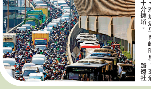
▲雅加達早高峰時段，交通十分擁堵。

【大公報訊】綜合美聯社、BBC報導：印尼在1945年脫離荷蘭統治獨立，此後遷都的想法曾好幾次浮出水面。雅加達整座城市坐落在海岸邊的一片沼澤地帶上，共有13條河流在這裏縱橫交錯。由於地下水抽取無節制，再加上氣候暖化引發的海平面上升，雅加達被形容為全球下沉速度最快的大型城市。雅加達近年洪患不絕，人口膨脹、交通擁擠和空氣污染嚴重，遷都勢在必行。雅加達市內有1100萬居民，但市內三分之一的居民無法獲得自來水。雅加達地表水污染嚴重，供水系統由私人公司運營，自來水價格昂貴，許多居民無力負擔，便依靠非法開挖的水井解決用水問題。民眾常年抽取地下水導致下沉危機加劇，也增加了洪災風險。有研究顯示，雅加達目前正在以每年1至15厘米的速度下降，北部沿海地區在過去10年裏下降了2.5米，2050年約95%的沿海土地將被海水淹沒。雅加達還面臨空氣污染和交通擁堵等問題。雅加達空氣質量近年持續惡化，多次名列全球空氣污染最嚴重的城市。印尼環境和林业部數據顯示，44%的空氣污染來自交通運輸。雅加達是全球交通最擁擠的城市之一，每天有超過2000萬輛機動車輛在路上行駛，還有數百萬人來往於雅加達和衛星城。常年的交通堵塞使得當地居民戲稱自己「在車陣中慢慢老去」。據統計，雅加達每年因水災和堵車造成的經濟損失估計高達45億美元。