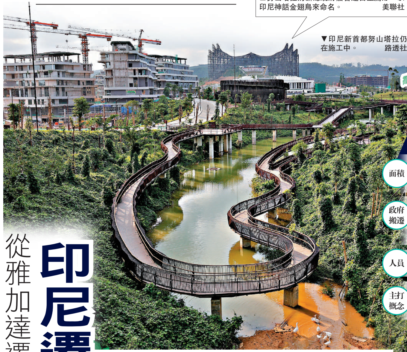
▼印尼新首都努山塔拉仍在施工中。