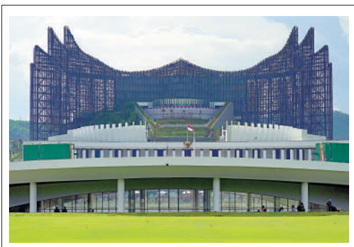
▲努山塔拉的新總統府嘉魯達宮呈鷹形，以印尼神話金翅鳥來命名。

印尼17日迎來79周年國慶，總統佐科出席在新首都努山塔拉總統府舉行的國慶儀式。該慶祝活動原定是努山塔拉作為新首都的落成典禮，但由於施工延誤和資金不足的問題，慶祝活動規模大幅縮小。努山塔拉目標是成為東南亞首屈一指的綠色城市，但工程進展挑戰重重，再加上印尼新政府將於十月上台，其未來發展命運目前尚未可知。