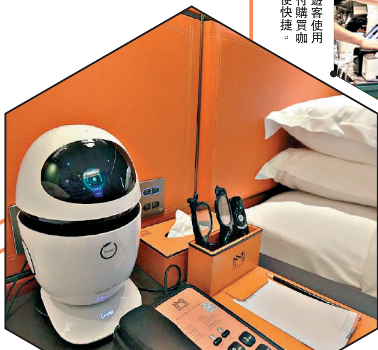
中國酒店的智能設備，令外國遊客耳目一新。