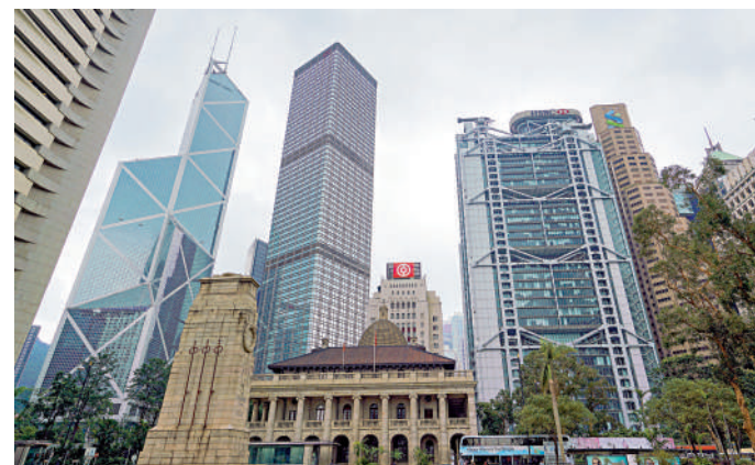
▲銀行界積極與金管局合作，加強保障客戶。

阮國恒說，金管局及香港銀行至今並未發現有騙徒利用深度偽造成功通過銀行開戶或高風險交易的身份驗證，但會繼續密切關注相關的詐騙手段。金管局會提供更多深度偽造的樣本供業界分析，並於適當時候發出指引。