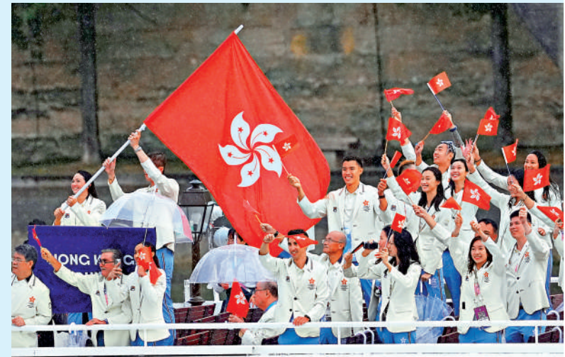
▲巴黎奧運中國香港隊健兒將會在明日出席巴士巡遊，近距離接受市民祝賀。圖為中國香港隊參加巴黎奧運開幕式的情況。