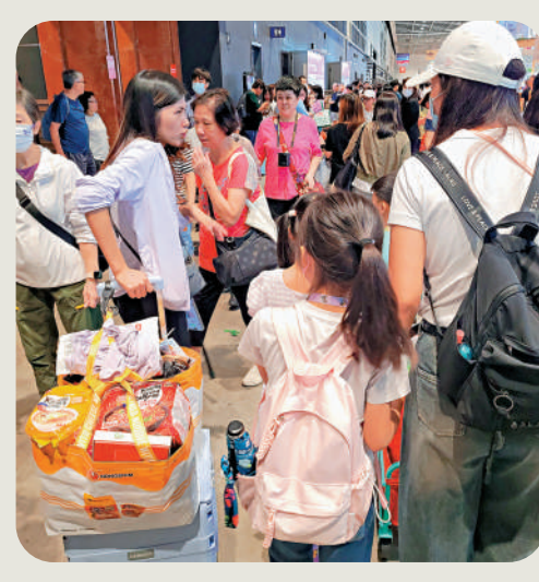
▲市民帶手推車掃貨，載滿美食而歸。

商貿展覽方面，美食商貿博覽及香港國際茶展吸引約20500名來自世界各地的買家，主要來自中國內地、台灣、印尼、日本、韓國、馬來西亞、菲律賓及泰國等，引證香港作為區內重要的食品貿易中心的地位。