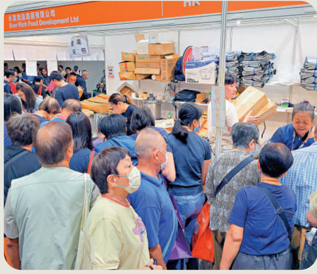
▲美食博覽人頭湧湧，生意不俗。

港鐵為慶祝服務香港45周年推出一系列活動，昨日於社交平台發文，貼上一張M-Train（現代化列車）的車廂內部照片，天花貼上橙啡色貼紙，又換上經典的黑色「波波扶手」。貼文大賣關子，指車廂設計不同了，但又似曾相識，「扶手好似時光倒流咁，但睇落又唔似係九龍站嘅MTR Gallery同紅磡「站見」嘅展品。」似暗示是45周年慶祝活動，指屬秘密任務，「敬請期待」。不少鐵路迷相信，該車廂是港鐵45周年主題列車，鐵路迷圈子內流傳多時的「白頭列車慶周年」的傳聞，又引起熱議。