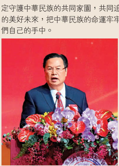
程學源希望，廣大海外僑胞和港澳同胞共同追求和平統一的美好未來，把我們自己的命運牢牢地掌握在我們自己手中。

中國僑聯黨組成員、副主席程學源指出，全球華僑華人促進中國和平統一大會是海內外僑胞共商祖國統一、共謀民族復興的重要平台。2000年在柏林舉辦第一屆大會以來，已經連續舉辦22屆，在推進祖國統一的進程中發揮了獨特的作用。世界上只有一個中國，大陸和台灣同屬一個中國，這是不容置疑的歷史和法理事實。 然而，一段時間以來，民進黨當局頑固堅持「台獨」分裂立場，不承認體現一個中國原則的「九二共識」，指使、縱容「台獨」頑固分子公然宣揚「兩國論」，大肆勾連外部勢力謀「獨」挑釁，蓄意挑動激化兩岸對立對抗，不斷加劇台海形勢緊張。希望廣大海外僑胞和港澳同胞秉持和弘揚愛國主義的優良傳統，團結一致，勦力同心，堅決反對「台獨」和外國勢力的干涉，堅