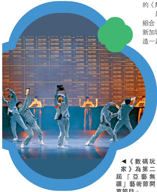
►《數碼玩家》為第二屆「亞藝無疆」藝術節開幕節目。