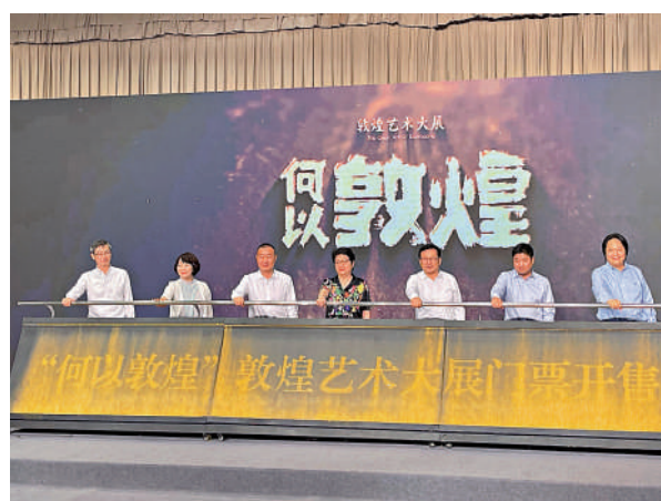
▲「何以敦煌」敦煌藝術大展正式開票。

這次展覽選取的6件文書，包括世界上現存最早標有明確紀年的雕版印刷品《金剛般若波羅蜜多經》，世界上現存古代星圖中年代最早、星數最多的《全天星圖》，現知最早的紙質抄本歷日《太平真君十一年、十二年歷日》，中國歷史上最早的一部圍棋論著《棋經一卷》，我國最早的由國家頒布具有藥典性質的藥學著作《新修本草》，以及中國最早的水利法典《開元水部式》。