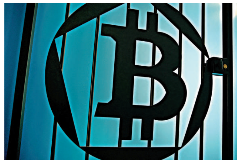
內地監管部門早前通過，把「虛擬資產」交易列為其中一項洗錢方式。

與此同時，由於香港大力發展虛擬資產經濟，內地先從虛擬資產最容易引發的嚴重犯罪作出回應。在此背景下，「U商」和普通投資者都應提高法律意識，確保交易合規，避免陷入法律風險。此外，行業從業者也應積極擁護監管，共同推動虛擬資產行業的繁榮發展。