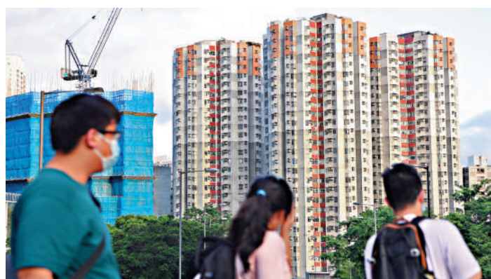
內地買家由於憂慮「遲買更平」，所以決定暫緩在港的置業計劃。

筆者認為，本地銀行落兩收遮，加上樓市跌勢持續，正所謂「寧買當頭起，莫買當頭跌」，不少內地客都與港人心態都是一樣，覺得「遲買更平」而嚇怕入市意欲。然而，現時市場普遍認為美國聯儲局9月19日的議息會議會開始減息，屬重要利好消息。當市場又感覺到「遲買更貴」的時候，他們自然會再入市。