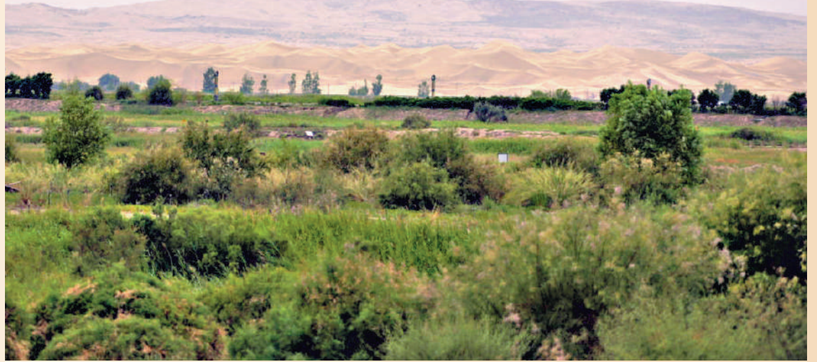
▲龍游灣國家濕地公園綠意盎然。