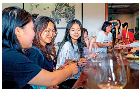
▲學子們參訪吉奧尼酒莊。

佳釀輕啟，細細涓流入杯中；緩緩搖曳，沁人心脾的酒香交織於酒釀與高腳杯的碰撞，喚醒學子們味蕾的期待。抿一小口嘗嘗，果味的鮮香在舌間流動；細細回味，餘味悠長。日前，參加「范長江行動」的香港傳媒學子抵達烏海市吉奧尼酒莊，探訪酒莊營