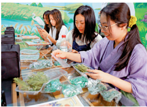
學子們在製作植物標本。

學生們最感興趣的是體驗DIY手工製作紀念品，利用生態館採購的天然植物葉子等材料，製作出了獨一無二的手工作品。