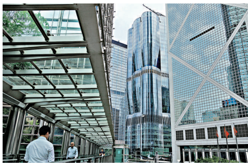
▲香港註冊成立的基金數據繼續向好。

報告又指出，24隻股票的人民幣櫃台自從於2023年6月推出以來，一直運作暢順。繼中國證監會於4月表示支持將人民幣櫃台納入港股通後，證監會一直與其緊密合作，進行相關準備工作。