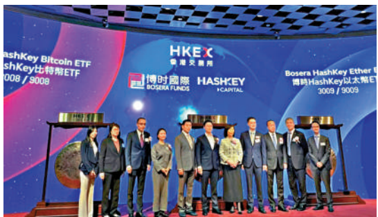
▲證監會認可的亞洲首批虛擬資產現貨ETF，當中包括比特幣及以太幣現貨ETF各三隻，已於今年4月在港交所上市。

代幣化方面，證監會已在多個場合就代幣化提供監管指引。證監會更是香港金融管理局成立的Ensemble項目架構工作小組的創始成員。該工作小組旨在就批發層面央行數碼貨幣（wholesale centralbank digital currency，簡稱wCBDC）、代幣化貨幣和代幣化資產，制訂業界標準。