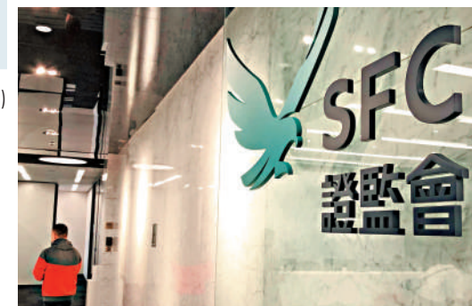
▲證監會三年內已完成審閱365宗上市申請。