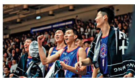
▲香港金牛贏球，球員開心慶祝。

首圈第二場將於本週日進行，金牛將轉為作客江西，只要球隊再贏一仗，便能提早闖入4強。