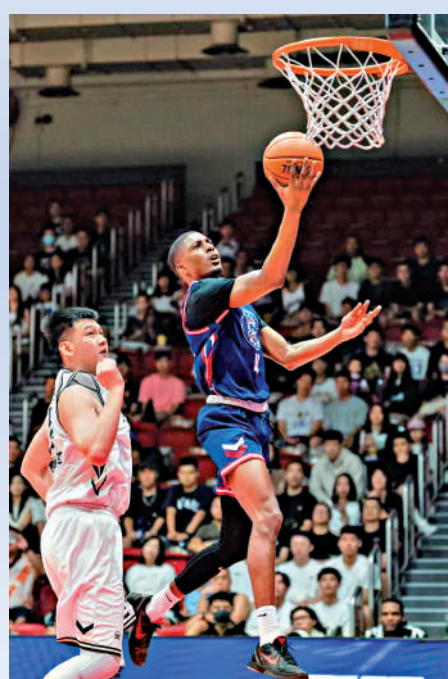
▲香港金牛的馬奇（右）上籃中。