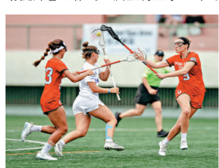
▲港U20棍網女隊（紅衫）不敵以色列。

本次2024世界棍網球女子U20錦標賽是一項「M」品牌認可活動，協助提升香港作為亞洲體育盛事之都的形象。