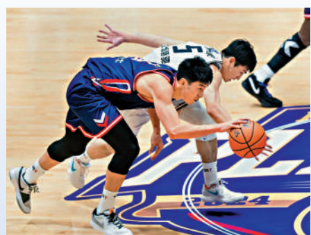
▲香港金牛球員（藍衫）表現拼搏，成功贏得NBL季後賽首圈首場比賽勝利。