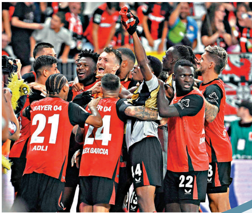
▲利華古遜上周擊敗史特加，奪得德超盃冠軍。