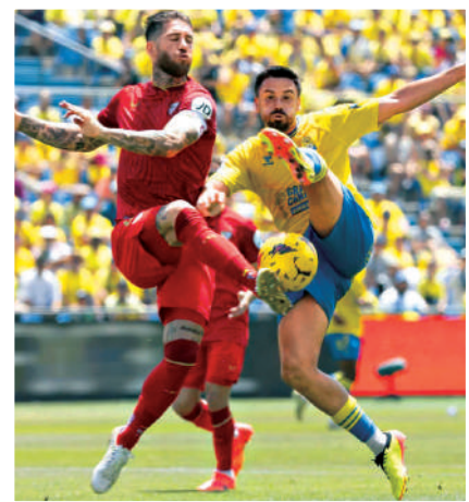
▲西維爾(左圖紅衫)與維拉利爾(右圖黃衫)首場西甲俱和波而回。