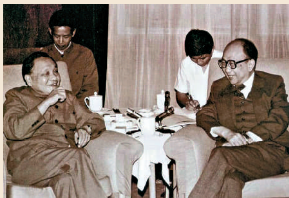
1982年，鄧小平在北京會見時任大公報社長費彝民。