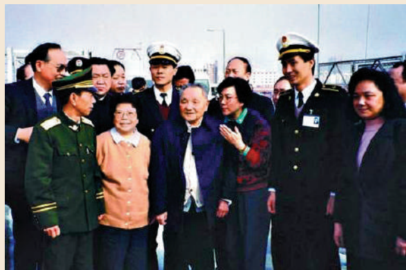
1992年，鄧小平在皇崗口岸深情眺望香港。