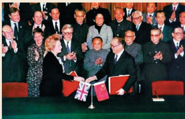
1984年，中英兩國政府就香港前途問題簽署《中英聯合聲明》。