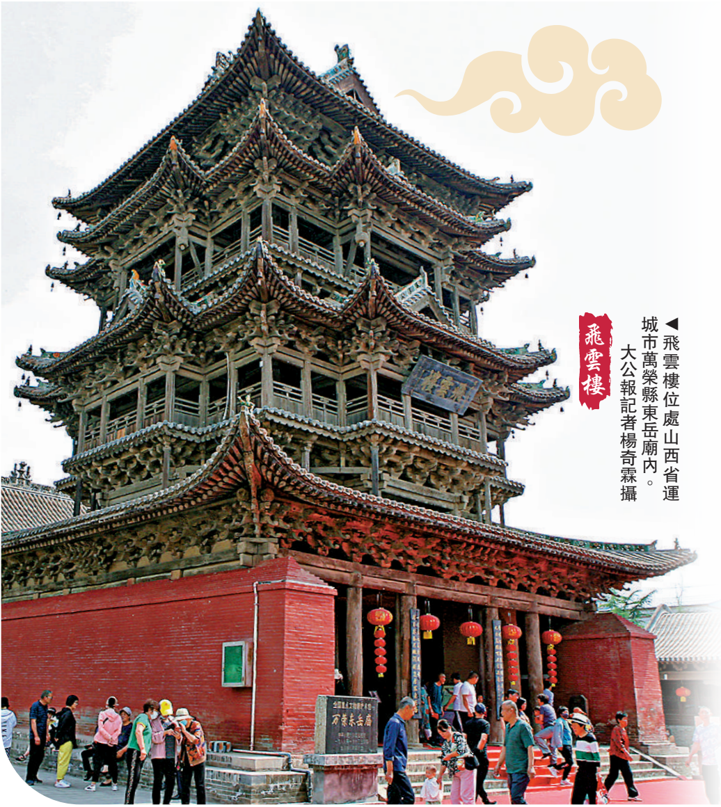
飛雲樓位於山西省運城市萬榮縣東岳廟內。

器、窮兵黷武，一步步將台灣綁上「台獨」戰車，裹挾台灣民眾當「台獨炮灰」，卻口口聲聲說希望兩岸和平發展，再次暴露了賴清德當局打着和平的幌子大搞「以武謀獨」「倚外謀獨」的虛偽嘴臉和陰險本質。