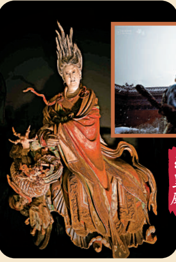
玉皇廟二十八星宿之一的亢金龍。