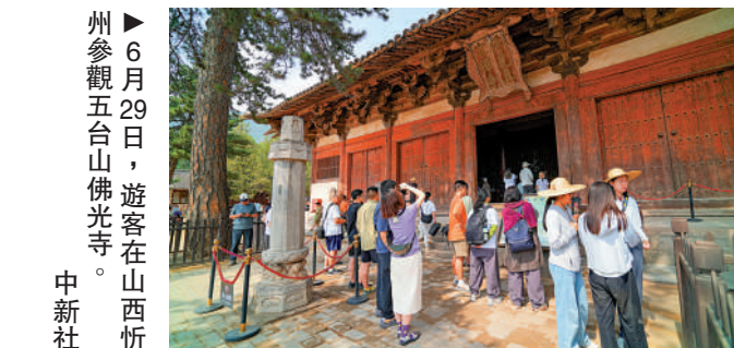
6月29日，遊客在山西忻州參觀五台山佛光寺。