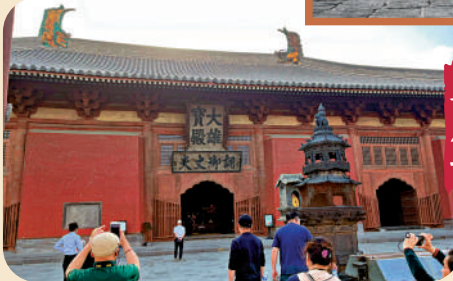
華嚴寺大雄寶殿位於大同古城內。