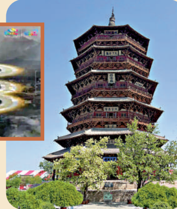
山西應縣木塔平面呈八角形。