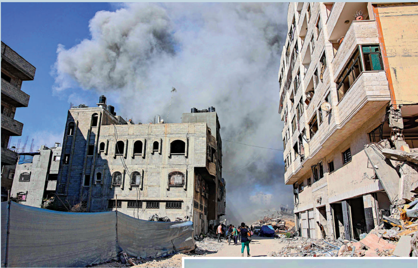
▲加沙城中部的一棟居民樓21日遭以色列空襲。