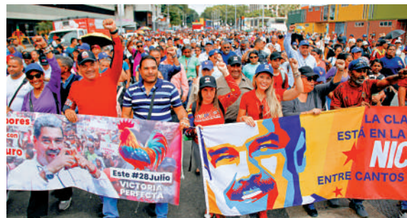
▲委內瑞拉首都加拉加斯民眾22日遊行支持馬杜羅。

馬杜羅於7月31日向最高法院選庭提出「保護訴訟」，要求其對選舉結果進行核實。8月1日，最高法院宣布開始對選舉展開司法調查，其間傳喚了參加選舉的10名候選人，並要求他們交出依法有權獲得的投票機器計票副本，但岡薩雷斯並未出席。羅德里格斯表示，反對派未能交出計票副本，以及岡薩雷斯不露面是「公然的不尊重」，必將因此受到制裁。