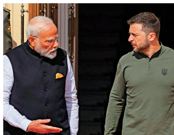
▲烏克蘭總統澤連斯基（右）23日在基輔與到訪的印度總理莫迪（左）會面。

CNN稱，烏克蘭一直試圖說服與俄羅斯保持密切關係的國家，推動普京接受基輔的和平條件。然而，儘管印度6月在瑞士出席了「烏克蘭和平峰會」，但並沒有支持這次會議發布的公報，稱解決方案需要「衝突雙方之間真誠和實際的接觸」。