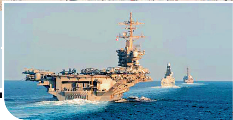
美軍近期在中東布重兵