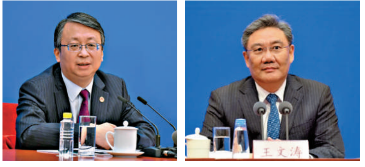
宣講團主講嘉賓包括全國人民代表大會憲法和法律委員會副主任委員、全國人民代表大會常務委員會法制工作委員會主任沈春耀（左），以及中華人民共和國國務院黨組書記、部長王文濤（右）。

和理解三中全會精神的具體內容和重大意義。 宣講會8月26日下午3時至5時30分在網上直播，市民屆時可在政府網上廣播或政制及內地事務局Facebook專頁收看，本港主要電視台也會直播。 宣講會完整內容稍後上載於政制及內地事務局網站： www.cmab.gov.hk/tc/home/index.htm