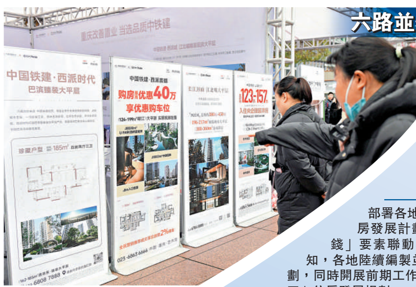
▲2024重慶春季房地產暨家居展示交易會上，市民了解樓盤信息。

住建部還公布了保障性住房籌建的最新進展，據董建國介紹，今年1至7月，全國保障性住房和城中村改造安置住房已經開工和籌集235萬套（間），完成投資4400多億元。「可能有人認為，『好房子』是改善性住房、商品房追求的，保障性住房就可以質量低一些、配套差一些，這是個誤解。」董建國說，保障性住房是政府工程，是民心工程，保障性住房更應該建成「好房子」，這是政府應該做到的，也應該做好的事情。目前，各地已經確定了一批保障性住房示範項目。