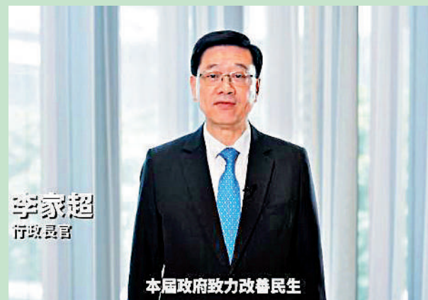
▲李家超在社交媒體新視頻回顧過去一年的工作，並鼓勵市民就施政報告踴躍發表意見。