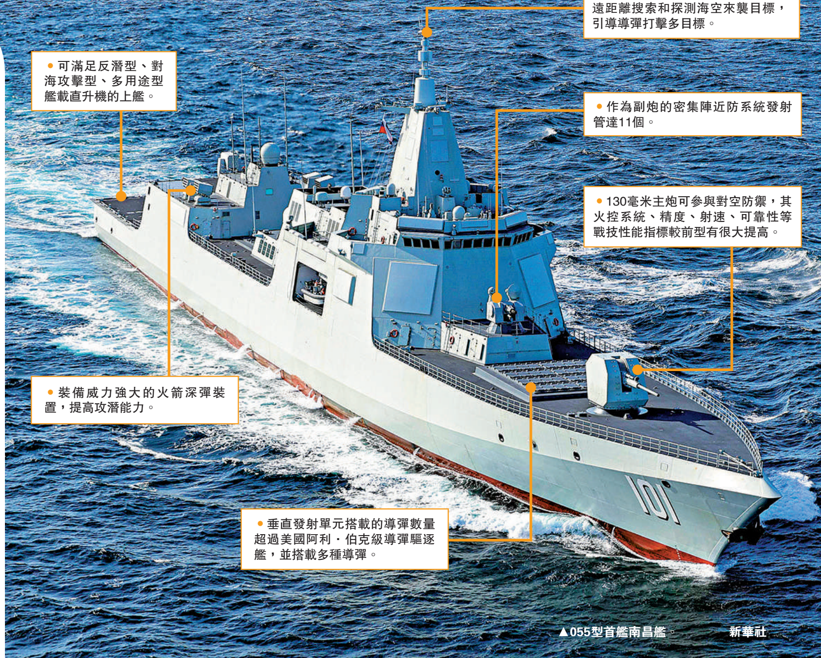
▲ 055型首艦南昌艦