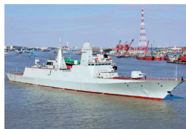
▲ 新一代054B型護衛艦首兩艦已經下水，目前正進行海試。

就在外界認為054B型將逐步取代054A型之時，054A型開建第六批次。其突出變化有三處：一是將原來的76毫米艦炮換成了054B同款的新一代100毫米艦炮。二是採用了與052D型驅逐艦相同的有源相控陣多功能雷達，取代了原來的三坐標快反雷達，提升了對水面和低空的多目標接戰能力。三是加長了直升機起降甲板，以更好地適配直-20F上艦，補足反潛短板。