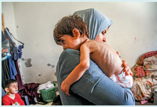
▲九成加沙兒童營養不良。