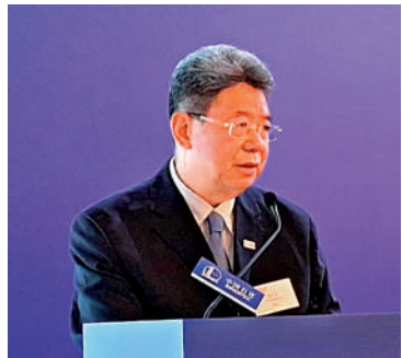
▲馬永生表示，未來會加快發展氫能等綠氣能源。

中石化早前提出打造成為中國第一氫能公司。中石化董事長馬永生稱，該公司在發展氫能事業具備優勢，未來會加快發展氫能等綠氣能源。不過，公司管理層考慮到效益問題，投資步伐比較審慎，上半年增設加氫站數量並不多。截至6月底，中石化在內地建成131個加氫站。馬永生在3月份曾表示，在內地設有128個加氫站。