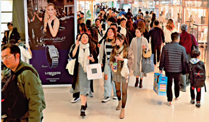
▲興業證券看好九置的前景。圖為九置旗下海港城商場。