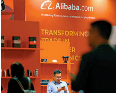
▲高盛表示，阿里巴巴將有望於9月9日被納入港股通。

來，大部分公眾流通股已轉倉到香港，在市值和交易量方面，阿里一直位列港股前三名，這代表了阿里巴巴早已有條件在香港主要上市。