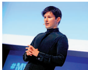
捕夫。Telegram創辦人杜羅夫24日在法國巴黎被捕。

佩斯科夫表示，「他們（法國）到底想指控杜羅夫何種罪名？」杜羅夫被逮捕一事，再次掀起互聯網言論自由的辯論。科技大亨馬斯克為杜羅夫辯護，批評法國此舉損害歐洲的言論自由。