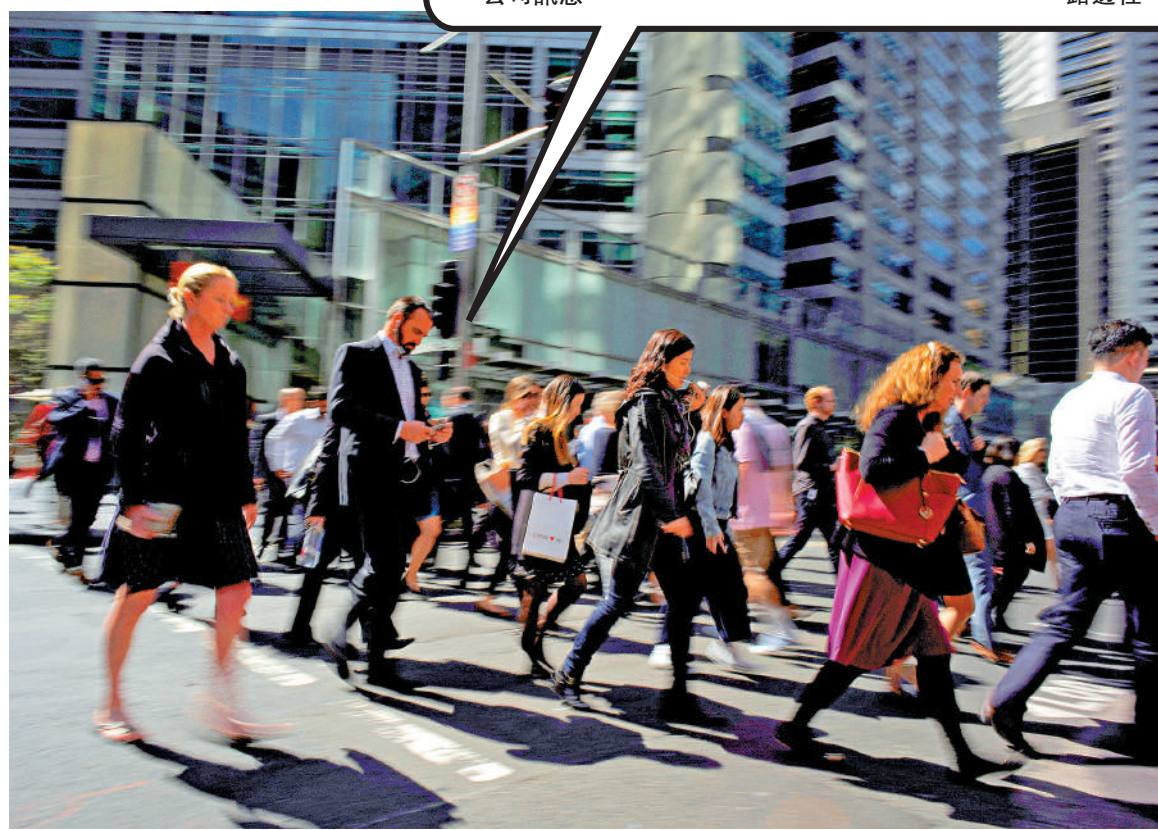
▼澳洲「斷聯權」新法26日生效，允許員工下班後不回覆公司訊息。

非工作時間依然可以聯繫員工，而員工只有在擁有「合理理由」的情況下，才可以拒絕。至於員工的拒絕理由是否合理，則由澳洲公平工作委員會來決定。該委員會在聲明中表示，何謂合理的問題，將「視情況而定」，決定因素可能包括聯絡的原因、員工角色的性質，以及員工加班或隨時待命的報酬。