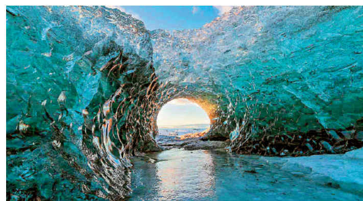
▲冰島東南部瓦特納冰原國家公園的布雷達馬庫約庫冰川。

報道指，遭遇事故的4人均為外國遊客，但目前暫未公布相關國籍信息，尚不清楚哪家旅遊公司組織了這次參觀。冰洞是冰島的熱門景點，不少旅行社為遊客提供了「探索冰川內部」的機會，讓遊客進入冰洞參觀。布雷達馬庫約庫冰川位於瓦特納冰原國家公園內，以冰洞聞名，但據冰島當地旅行社表示，最佳遊覽時間是冬季。