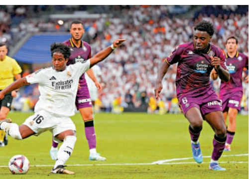
▲皇馬「新仔」安迪歷(左)後備上陣僅4分鐘便取得「處子球」。