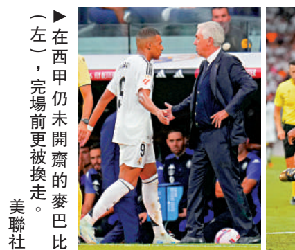
▶在西甲仍未開齋的麥巴比(左)，完場前更被換走。

馬德里體育會就憑基沙文、馬高斯洛蘭迪和後備佐治高基的入球，主場輕取神奇不再的基羅納3:0。