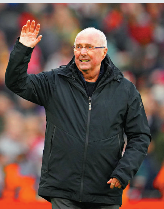
▲艾歷臣周一與世長辭。