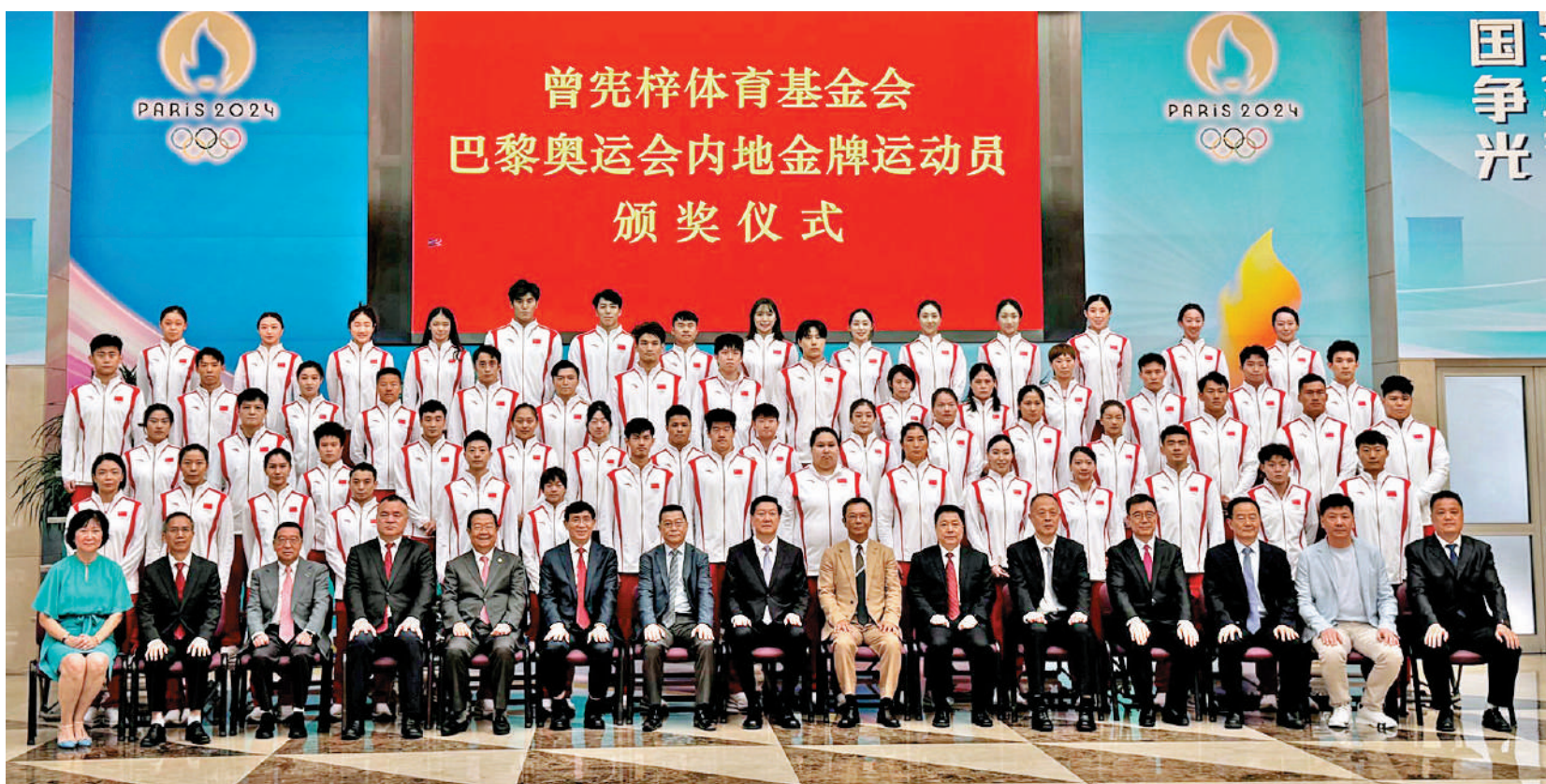
曾憲梓體育基金會巴黎奧運會內地金牌運動員頒獎儀式在京舉行。