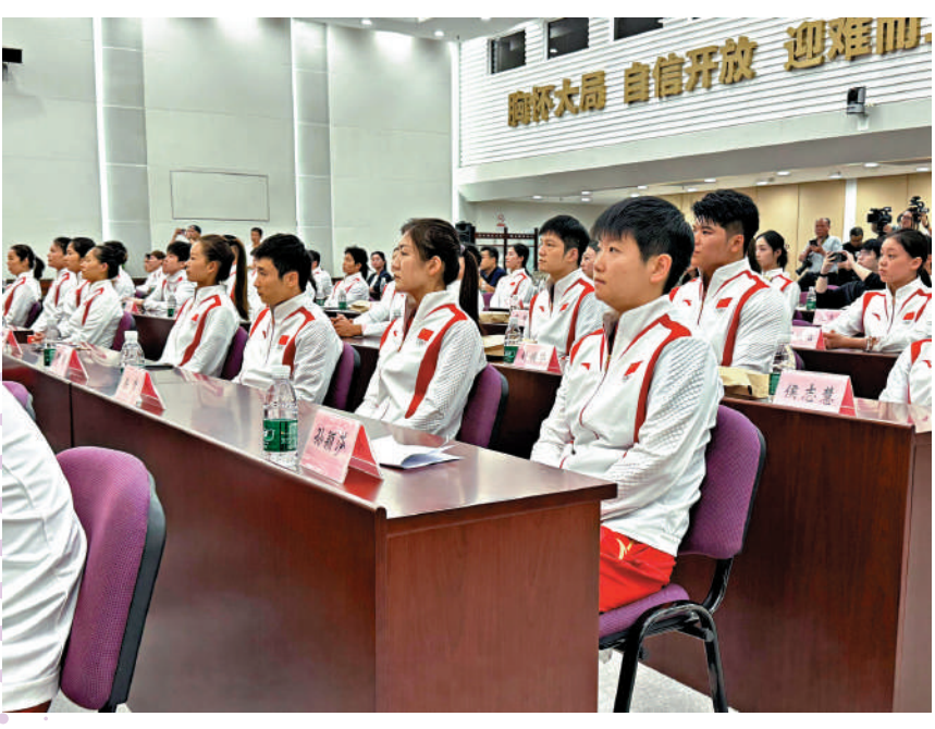
曾憲梓體育基金會獎勵巴黎奧運會內地金牌選手。

黃雨婷 (巴黎奧運會射擊混合團體10米氣步槍冠軍) 隨巴黎奧運會中國內地奧運健兒代表團到訪香港，將是我第一次到香港，對於整個行程非常期待，也期盼與香港市民見面。