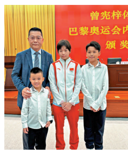
曾智明特意帶孩子參加頒獎儀式，更與跳水金牌選手全紅嬋合照。