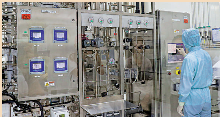
齊魯製藥廠區採用自動化、智能化生產，保證品質。大公報實習記者黃璟瑜攝