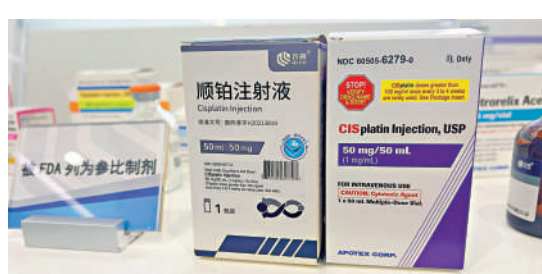
齊魯製藥順鉑注射液只需9個月便正式獲批出口到美國市場。

齊魯製藥順鉑注射液獲FDA特許，在限定時間內臨時進入美國，極大地緩解當地臨床用藥短缺的危機。李燕指出，產品僅用9個月就正式獲批出口到美國市場，產品的高質量水平得到國際認可，收穫良好口碑。2023年，集團實現銷售