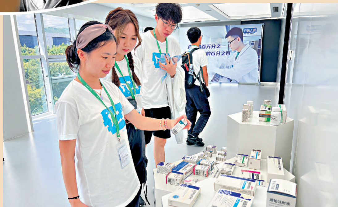
齊魯製藥向全球逾百個國家與地區出口產品，圖為香港傳媒學子參觀該集團的各類產品。