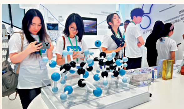
香港傳媒學子參觀華熙生物透明質酸博物館，前方為透明質酸的化學分子結構。