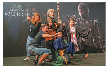
▲8月22日，人們在德國2024年科隆國際遊戲展《黑神話：悟空》拍照區拍照。

記》也被日本的文化和創意產業發掘過，比如光榮公司的《西遊記》和萬代南夢宮公司的《奴役：西遊記》。