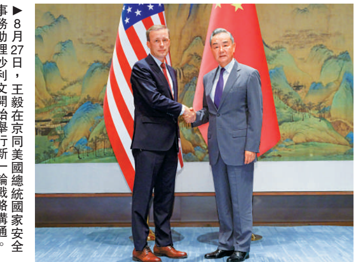
8月27日，王毅在京同美國總統國家安全事務助理沙利文開始舉行新一輪戰略溝通。

中共中央政治局委員、中央外辦主任王毅8月27日在北京同美國總統國家安全事務助理沙利文開始舉行新一輪戰略溝通。王毅表示，中美關係攸關兩國，牽動世界。落實好兩國元首舊金山會晤共識是中美雙方的共同職責，也是此次戰略溝通的主要任務。希望這次溝通一如既往是戰略性和實質性的，同時應該更具有建設性，推動中美關係朝着「舊金山願景」克服干擾、排除障礙，真正實現穩定、健康、可持續發展。