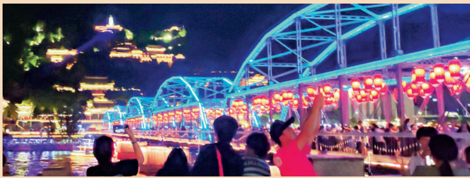
黃河夜景美不勝收。