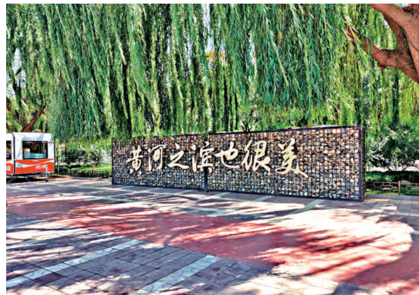
蘭州立足黃河流域文化特色，延續歷史文脈，迎接八方來客。「黃河之濱也很美」成為蘭州亮麗城市符號。

徐遊船穿行河面。在這裏，不僅欣賞到美麗的自然風光，體驗別樣、豐富的文化活動，還感受到蘭州人民的熱情好客和淳樸善良。