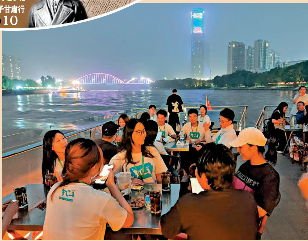
隴港學子夜遊黃河，了解蘭州城景交融一體的發展成果。