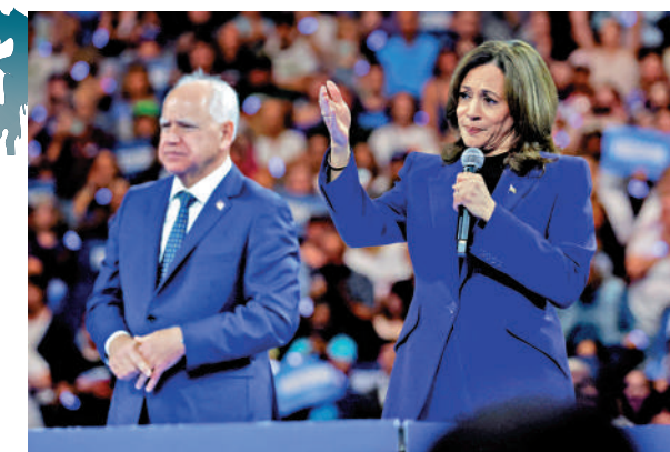
▲美國民主黨總統候選人哈里斯（右）及競選搭檔沃爾茲。

【大公報訊】作為美國歷史上首位被刑事檢控的前總統，特朗普目前面臨四宗刑事案件，包括「封口費」案、「密件門」案、密謀推翻2020年大選案和佐治亞州干預選舉案。