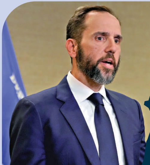
▲美國司法部特別檢察官史密斯。

● 雖然特別檢察官團隊試圖通過縮小指控範圍，繼續推動對於特朗普的案件審理，但該案在11月5日大選開始之前「極不可能」進入庭審階段。