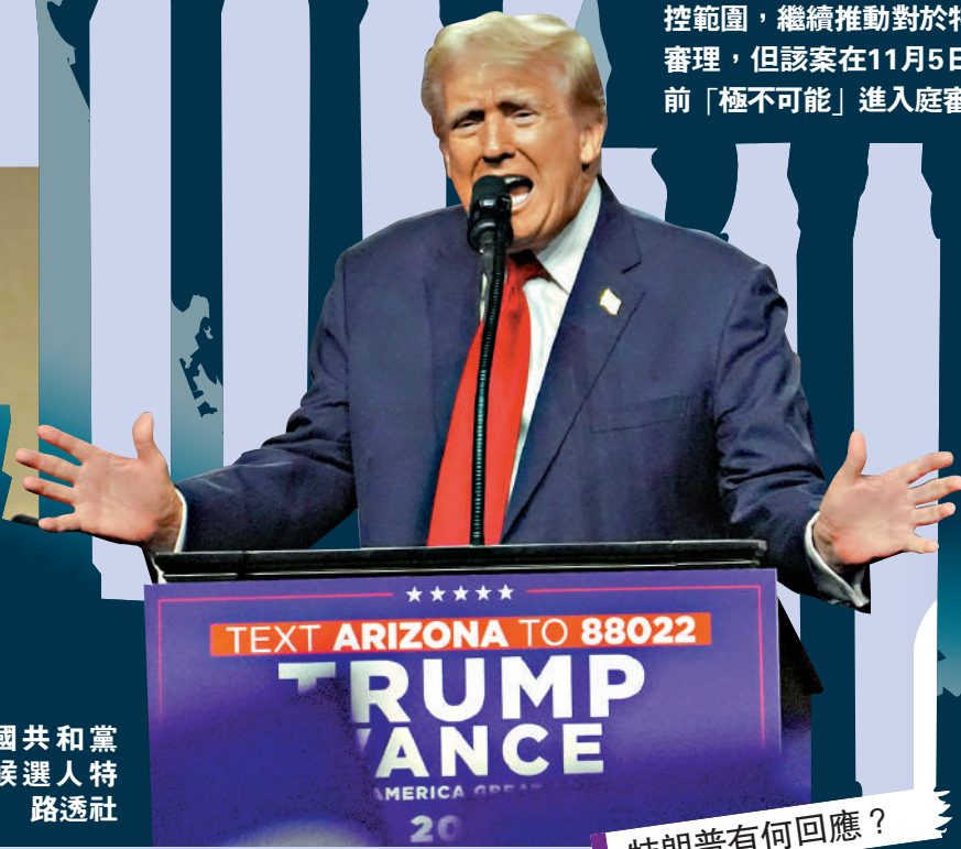
▶ 美國共和黨總統候選人特朗普。