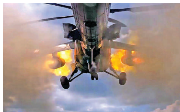
◀ 俄軍攻擊直升機在庫爾斯克地區向烏軍開火。

出席聯合國大會時與拜登會面，屆時將遞交烏克蘭的「勝利計劃」，這份計劃也會呈交給特朗普和哈里斯。他強調，該計劃能否成功很大程度上取決於美國是否繼續向烏方提供所需要的援助，以及烏克蘭是否被允許自由