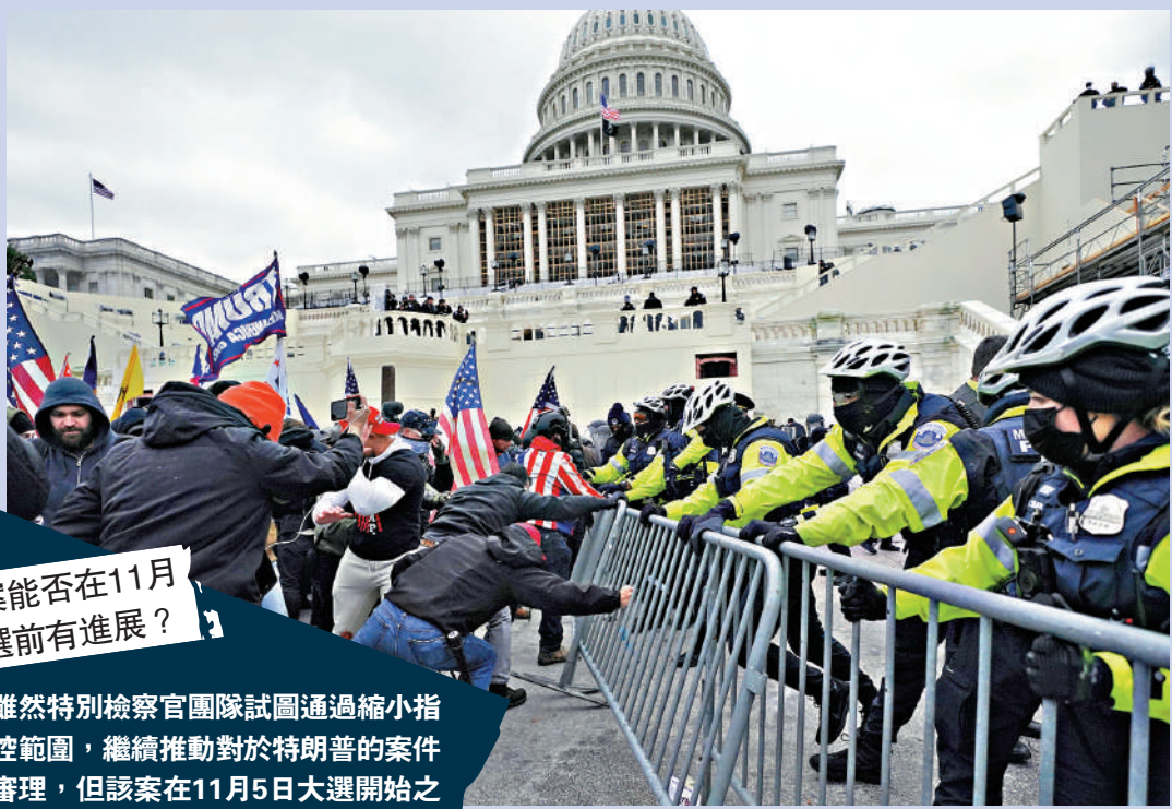
▲2021年1月6日，特朗普的支持者試圖強行衝進國會大廈，與警方發生衝突。

● 特朗普指責特檢團隊「重啟獵巫行動」，試圖干預選舉，目的是分散外界對「哈里斯給我們國家帶來的災難」的注意力。 大公報整理